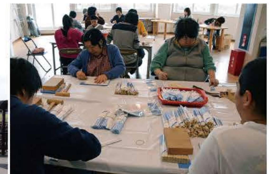
割り箸の袋詰め作業の様子(委託班)