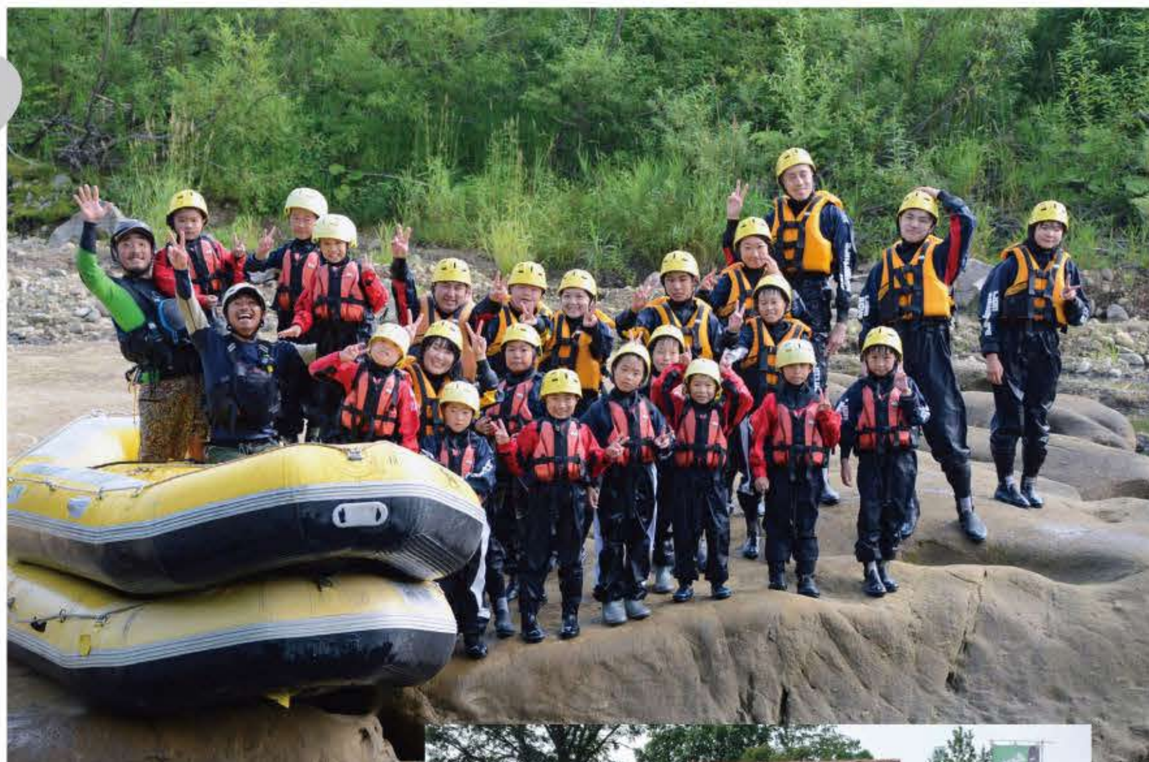
尻別川でラフティングに挑戦