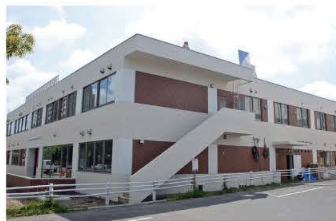
「拓北・あいの里福祉センター」

いよいよ10月、拓北・あいの里福祉センターがあいの里教育大駅前、地区センター隣接で開設します。このセンターは(1)高齢者部門<高齢者等共同住居・レストラン・デイサービス・ショートステイ等>とともに(2)北区児童発達支援センター(乳幼児から学齢の障がい児童への相談支援：従来の児童デイ「むう」「ひびき」)、(3)さらに障がい者の就労(清掃・介護など)の場等が用意されます。法人本部も設置される予定です。