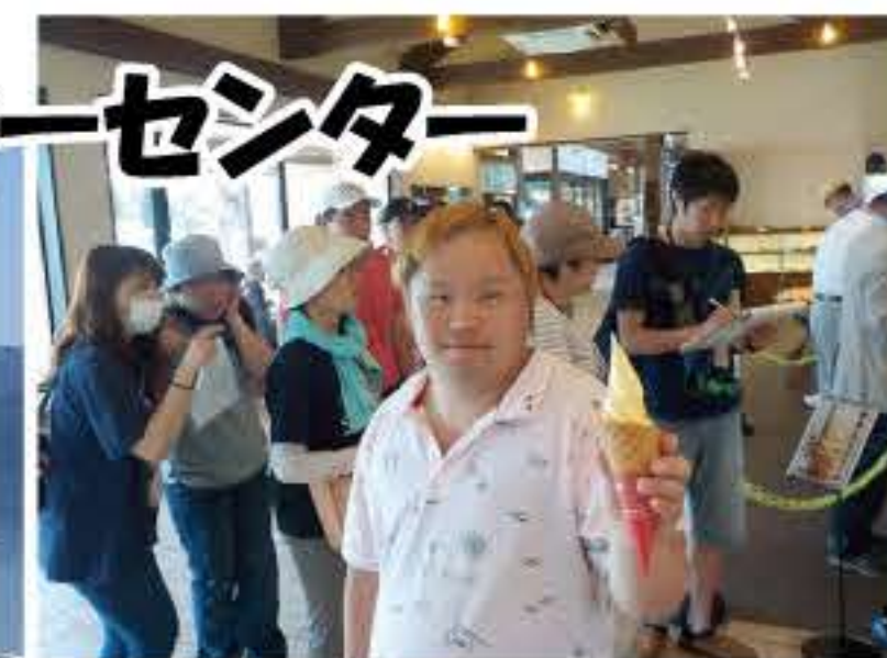
▲カボチャソフトクリーム 美味でした☆