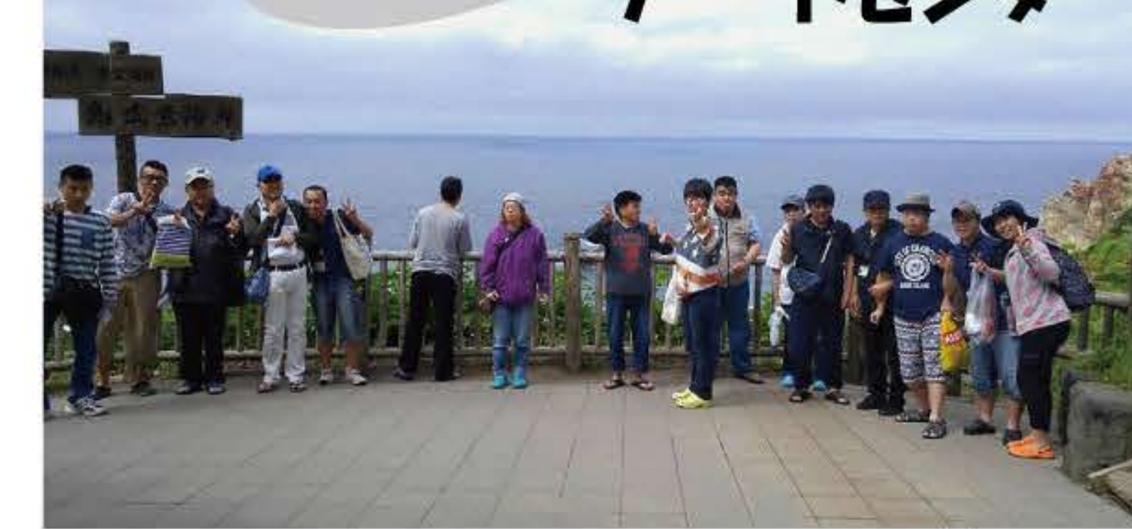
▲島武意海岸で記念撮影。クマ出没のため海遊びができなくて残念でした