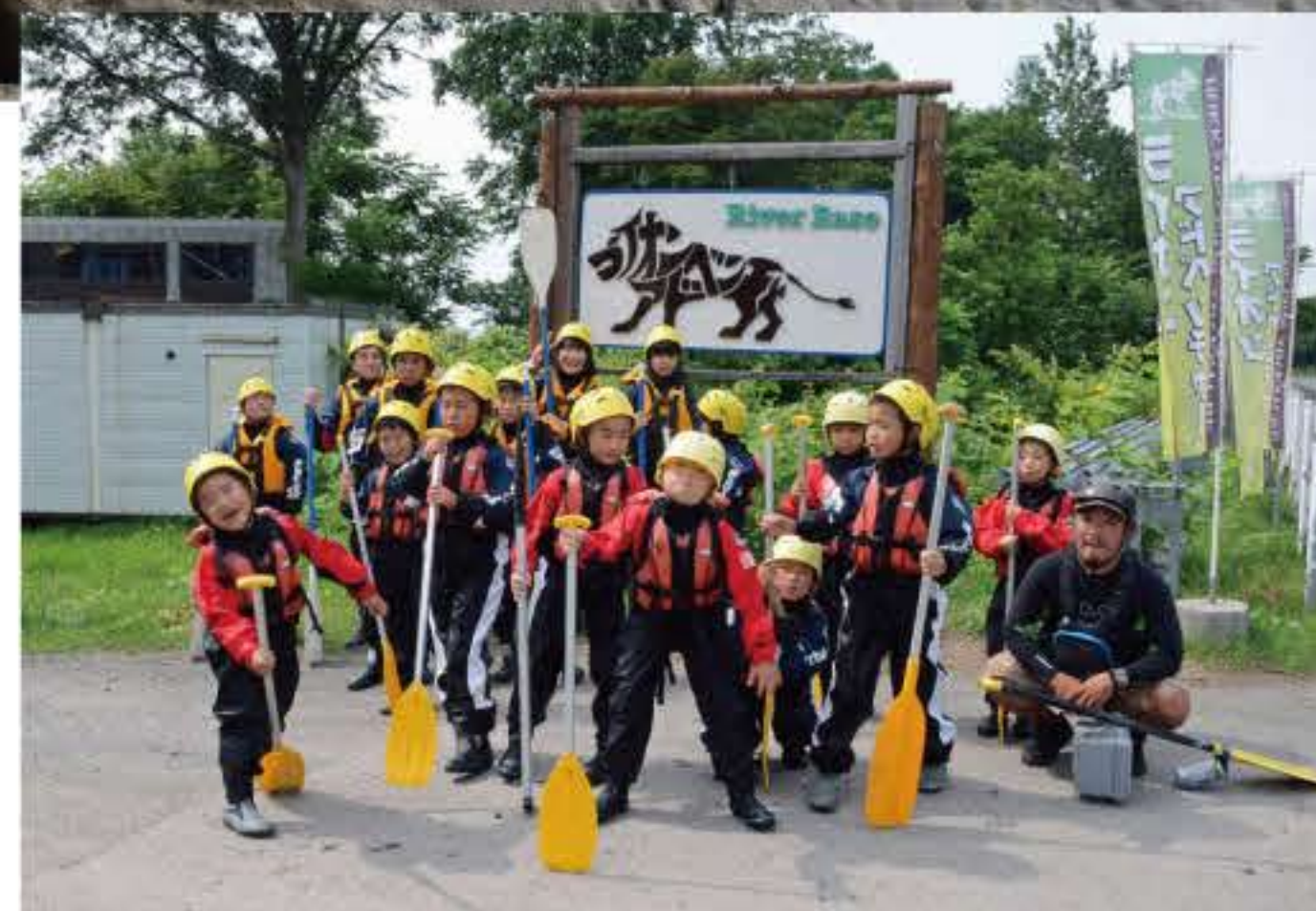
オールを持ってポーズ！