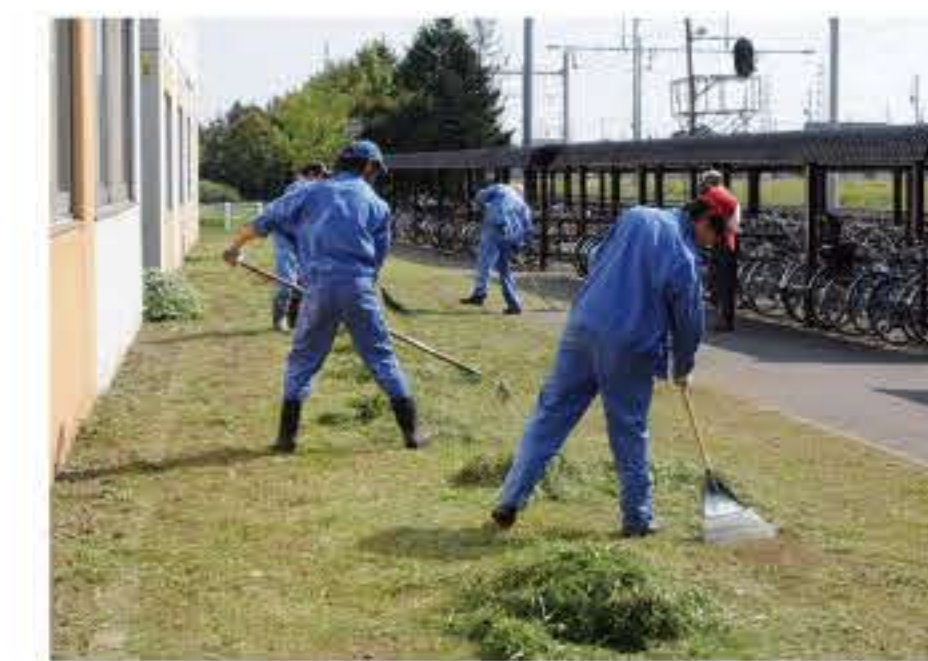
除草作業の様子(環境整備班)