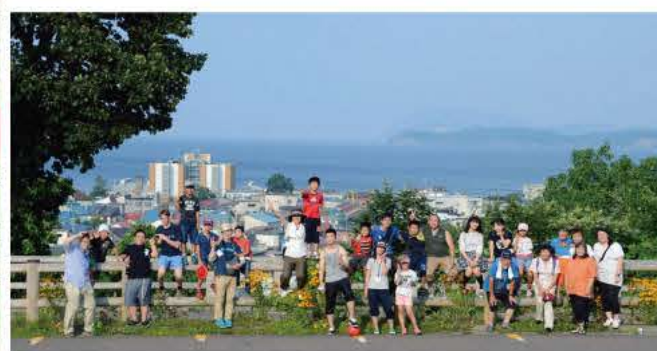
余市町の円山公園にて