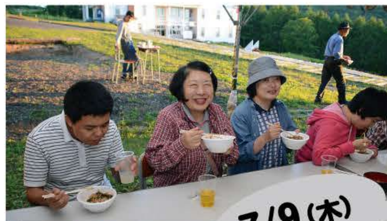
山の家で恒例の「あくていぶ井」!