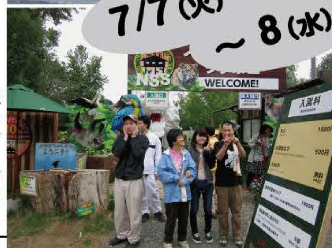
ノースサファリへようこそ! (1班目)