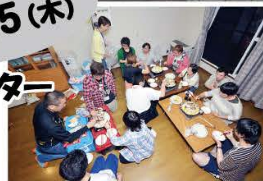
▲夕食のジンギスカンに舌鼓