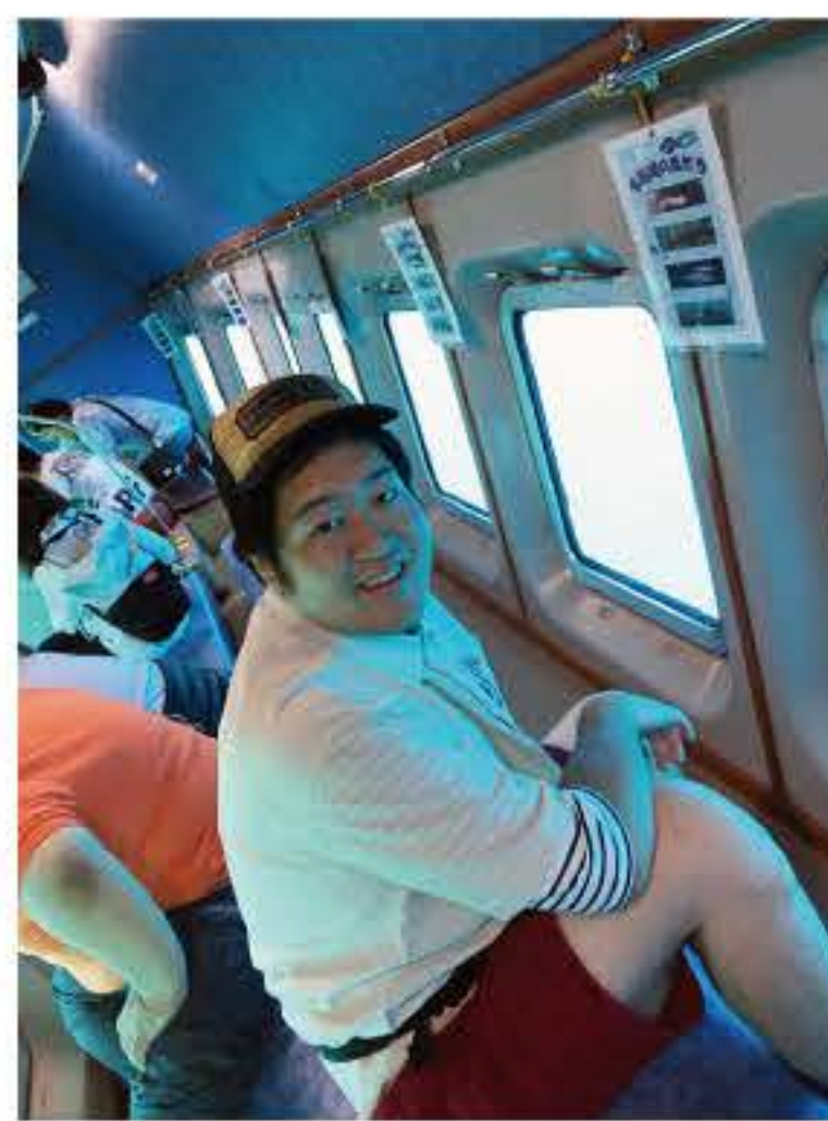
美味しそうな魚がいました♪