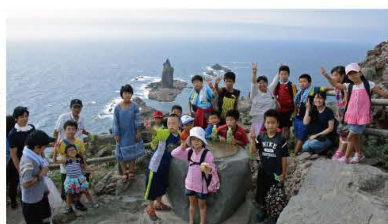
積丹町の神威岬にて