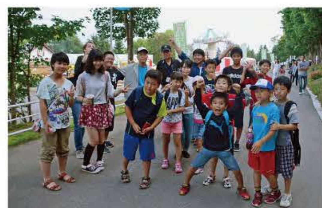
ルスツ遊園地にて