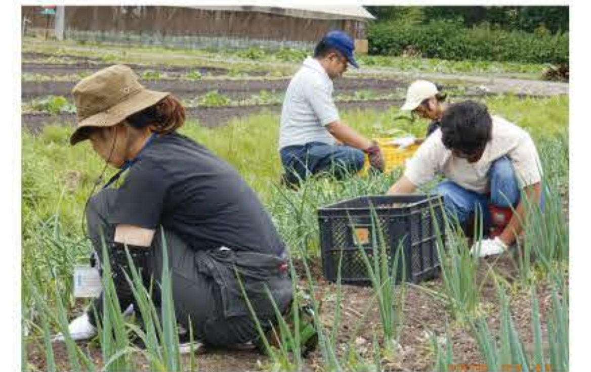
畑の草取り作業の様子(園芸班)