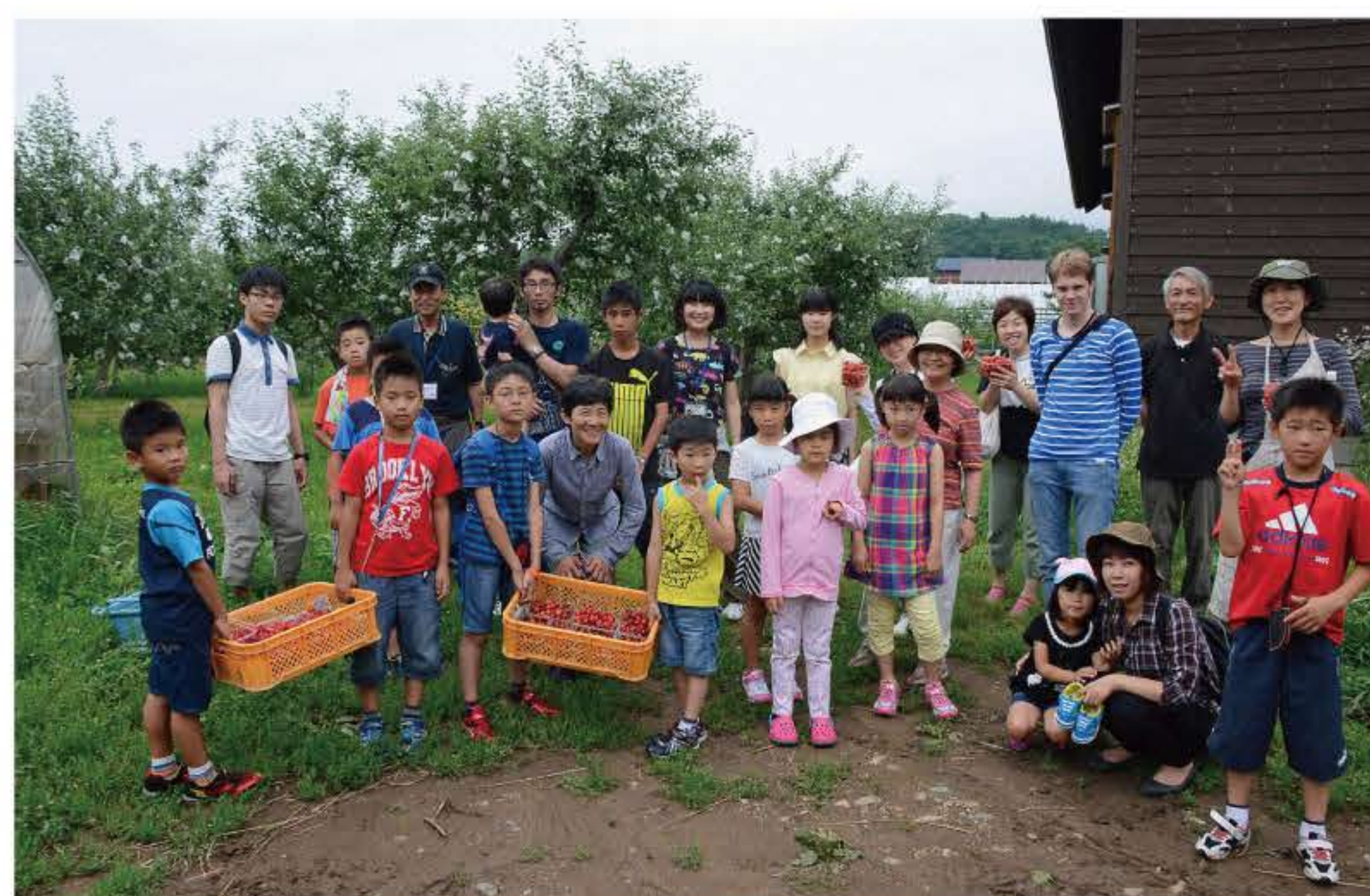
仁木町の山川農園でさくらんぼ狩り