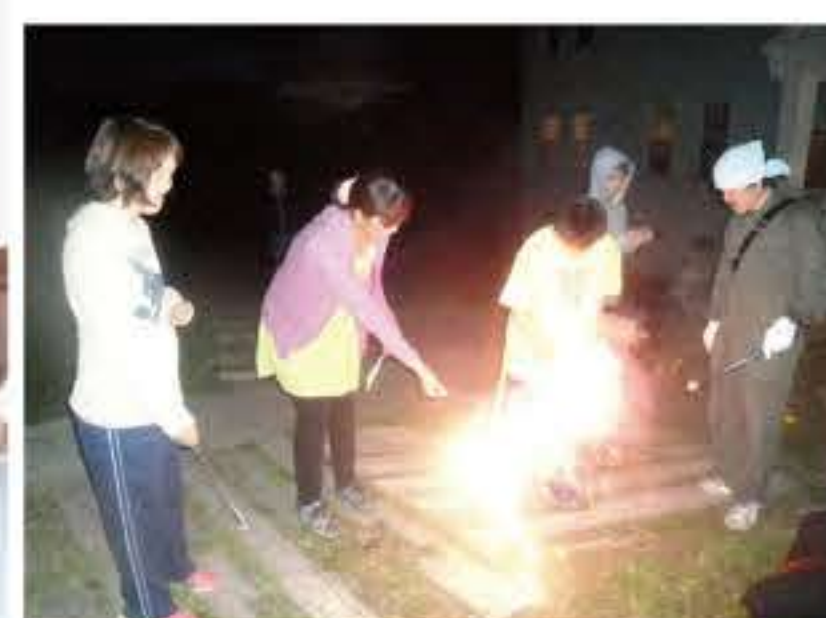
▲夜は花火を楽しみました