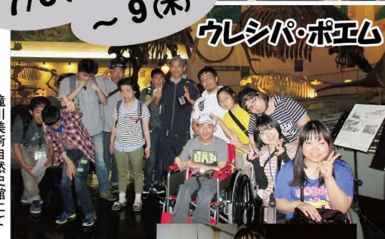
滝川美術自然史館にて (1班目)