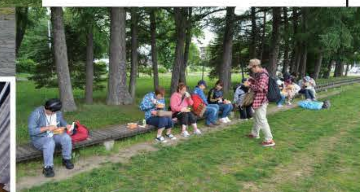
▲帯広の元世界一長いベンチで昼食