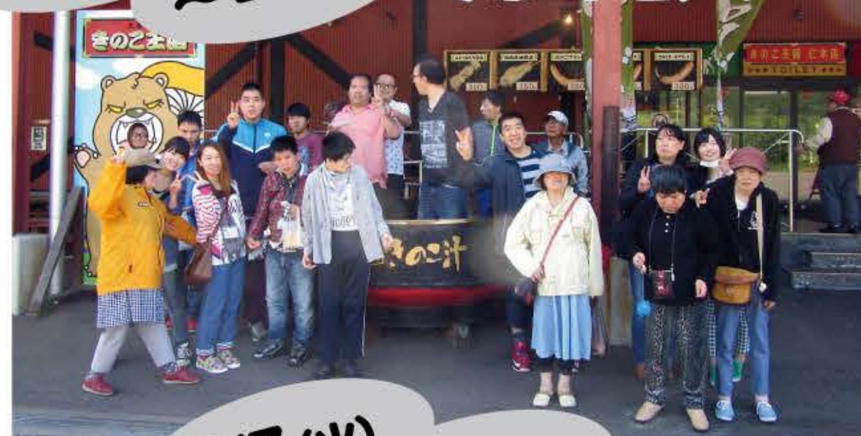
きのこ王国にて(2班目)