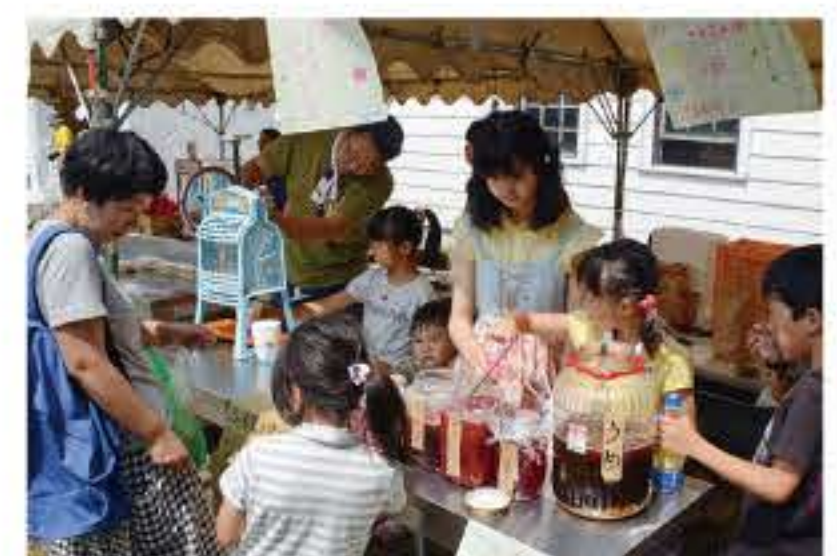
POPも手作りして 初めての販売体験！