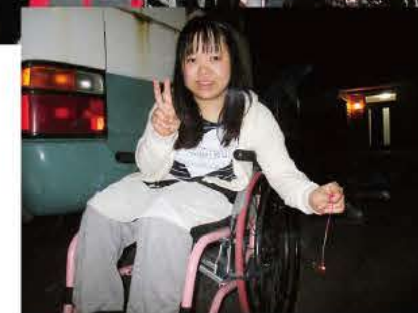
▲パッと咲いて~シュン と散って~?(1班目)