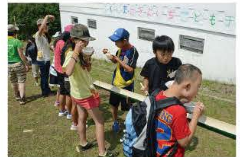
流しそうめんを楽しむ子どもたち