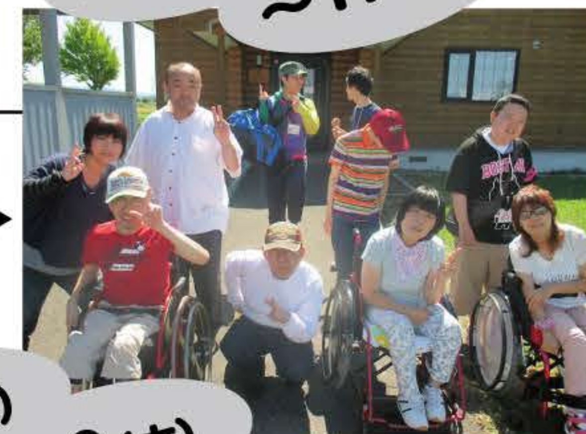
キャンプ場にて (2班目)