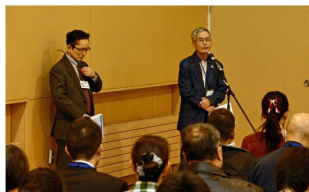
「実り多い研修会」に宮野常務理事