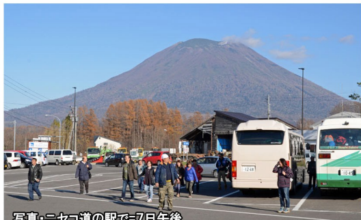
写真・ニセコ道の駅で7日午後