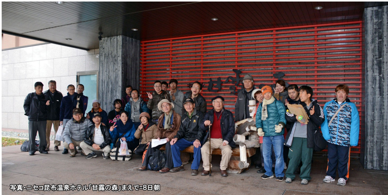
写真・ニセコ昆布温泉ホテル「甘露の森」まで=8日朝