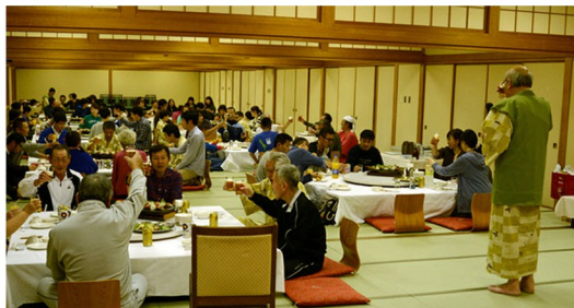
写真・ホテルの夕食、皆さんそろって「カンパニー」=7日

■宿泊はニセコ昆布温泉ホテル「甘露の森」、到着後はゆったりと湯につかり旅の疲れをいやし、その後の夕食、カラオケタイムと親子で参加された皆さんもテーブルを囲み楽しいひと時を過ごされていました。