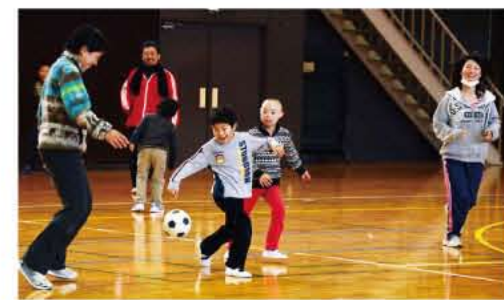
山村開発センターでスポーツレク。体育館には元気な歓声が響いた