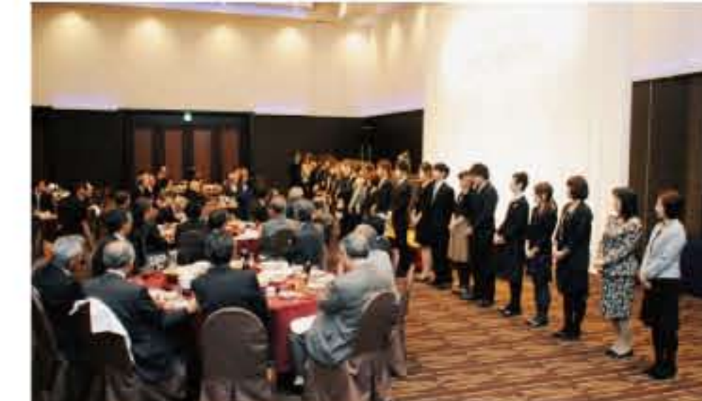
札幌協働保育園のスタッフを紹介

11月30日、ホテルエミシア札幌にて「札幌協働保育園改築祝賀会」を催しました。建築関係者の方々や法人関係者、拓北・あいの里連合町内会の方々、私保連会長、厚別区私立認可保育所連絡会の方々など総勢106名の方にご参加いただきました。