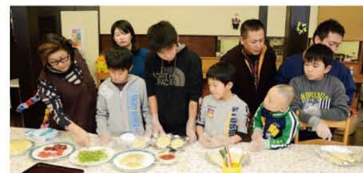
ピザ作りに挑戦。特製窯で焼き、出来上がりは...