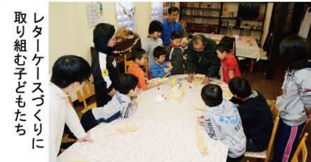
レターケースづくりに取り組み子どもたち