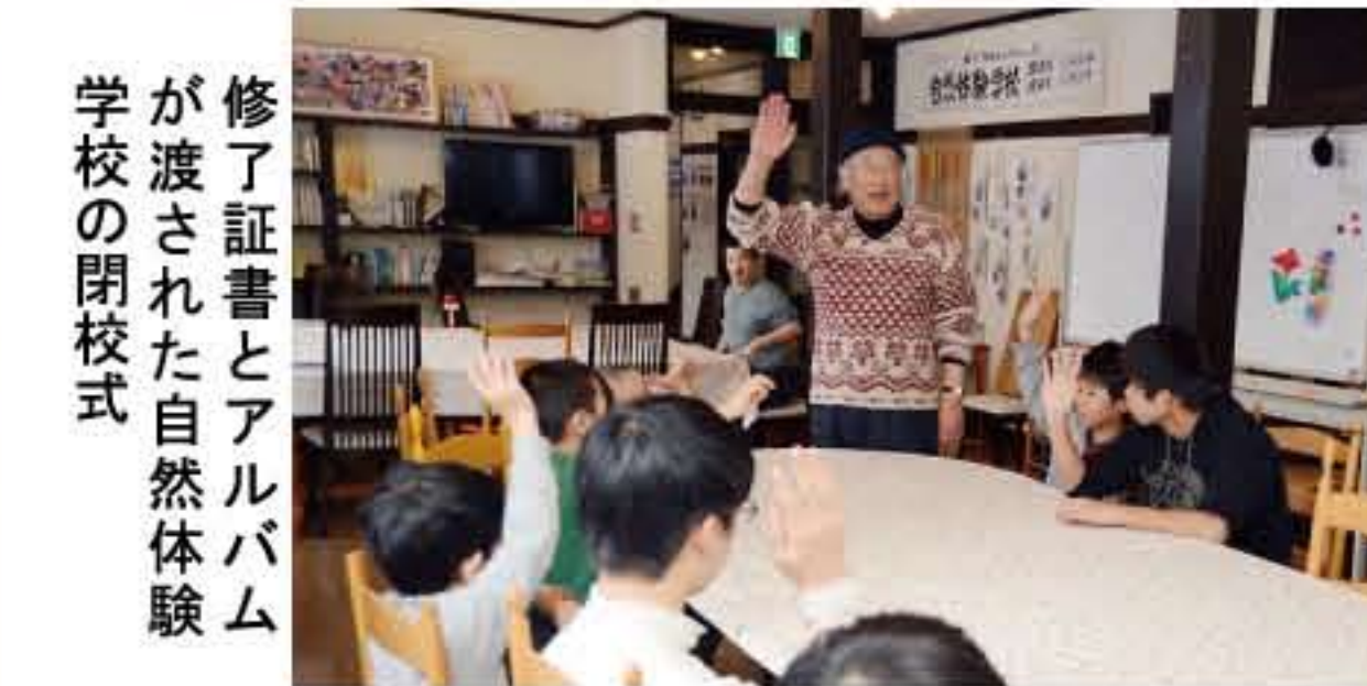
修了証書とアルバムが渡された自然体験学校の閉校式