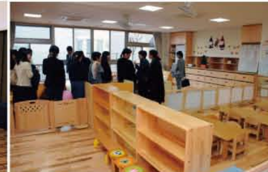
関係者、地域の皆様を迎え見学会