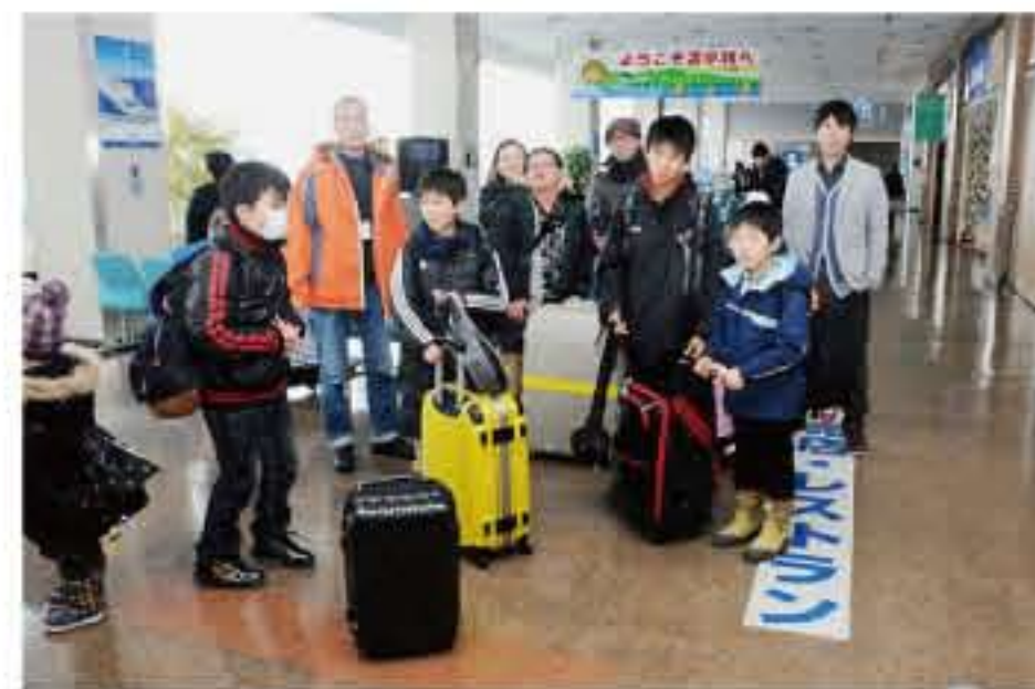
苫小牧フェリーターミナルに到着