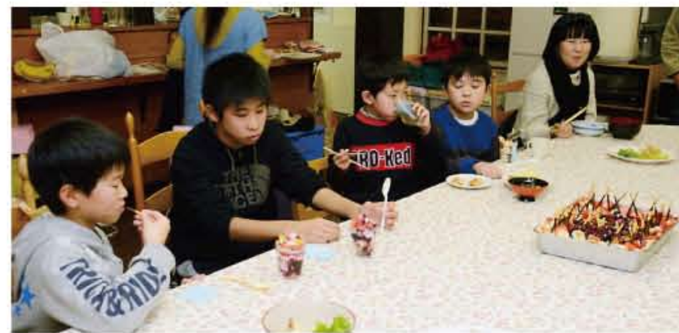
クリスマス会の様子