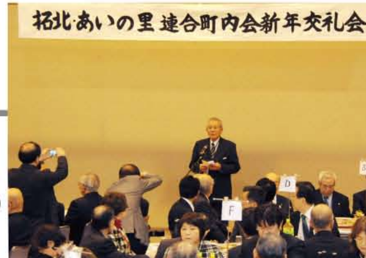
拓北・あいの里連合町内会新年交礼会

また、恒例の拓北地区ひまわり自治会主催の新年交礼会も、5日(月)ひまわり会館で約110名を超える参加者で行われました。