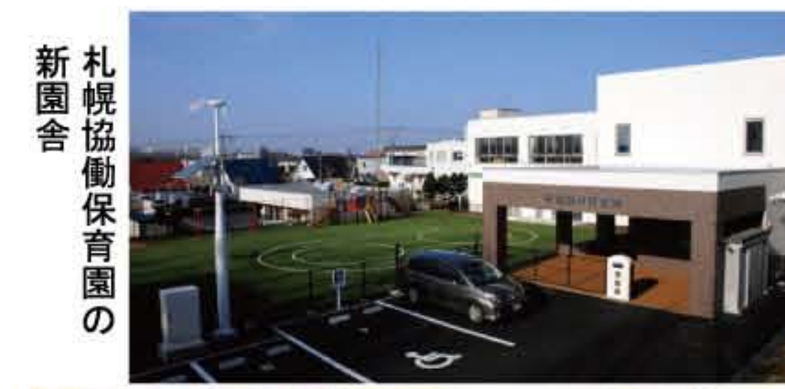
札幌協働保育園の新園舎

11月30日、ホテルエミシア札幌にて「札幌協働保育園改築祝賀会」を催しました。建築関係者の方々や法人関係者、拓北・あいの里連合町内会の方々、私保連会長、厚別区私立認可保育所連絡会の方々など総勢106名の方にご参加いただきました。