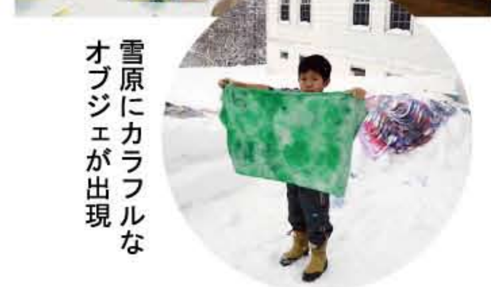
雪原にカラフルなオブジェが出現