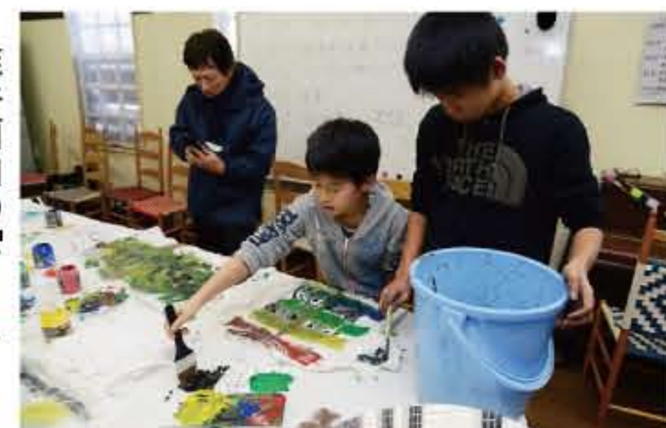
碓井画伯の「アートな時間」