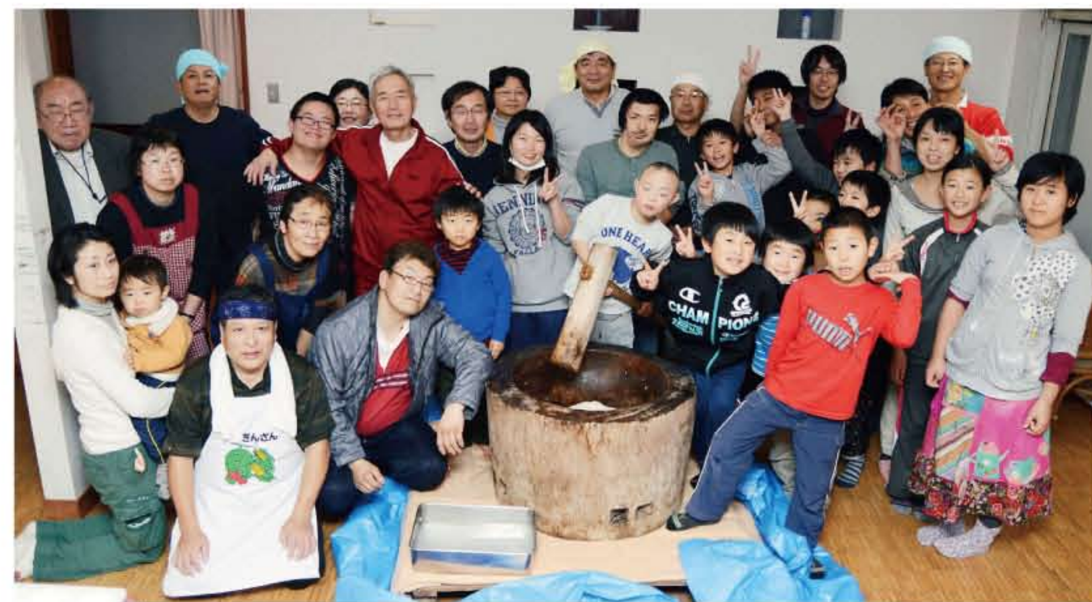
おいしいもちができました!