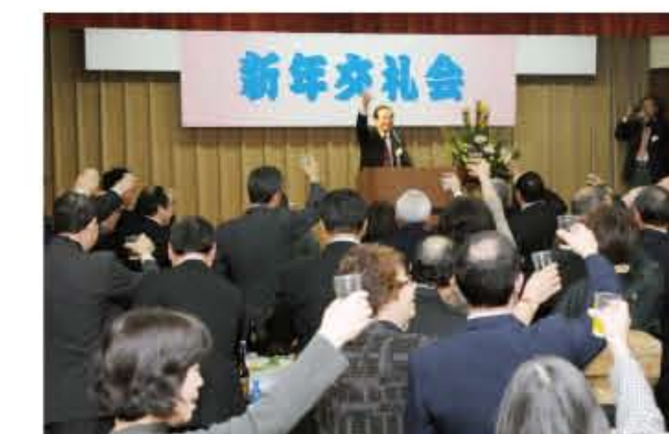
ひまわり自治会新年交礼会