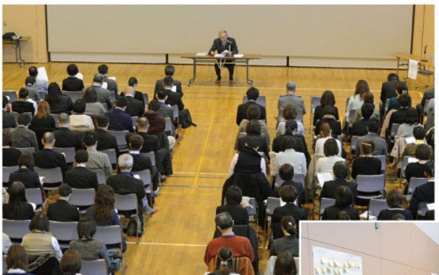
拓北・あいの里地区センター で開催された職員研修会