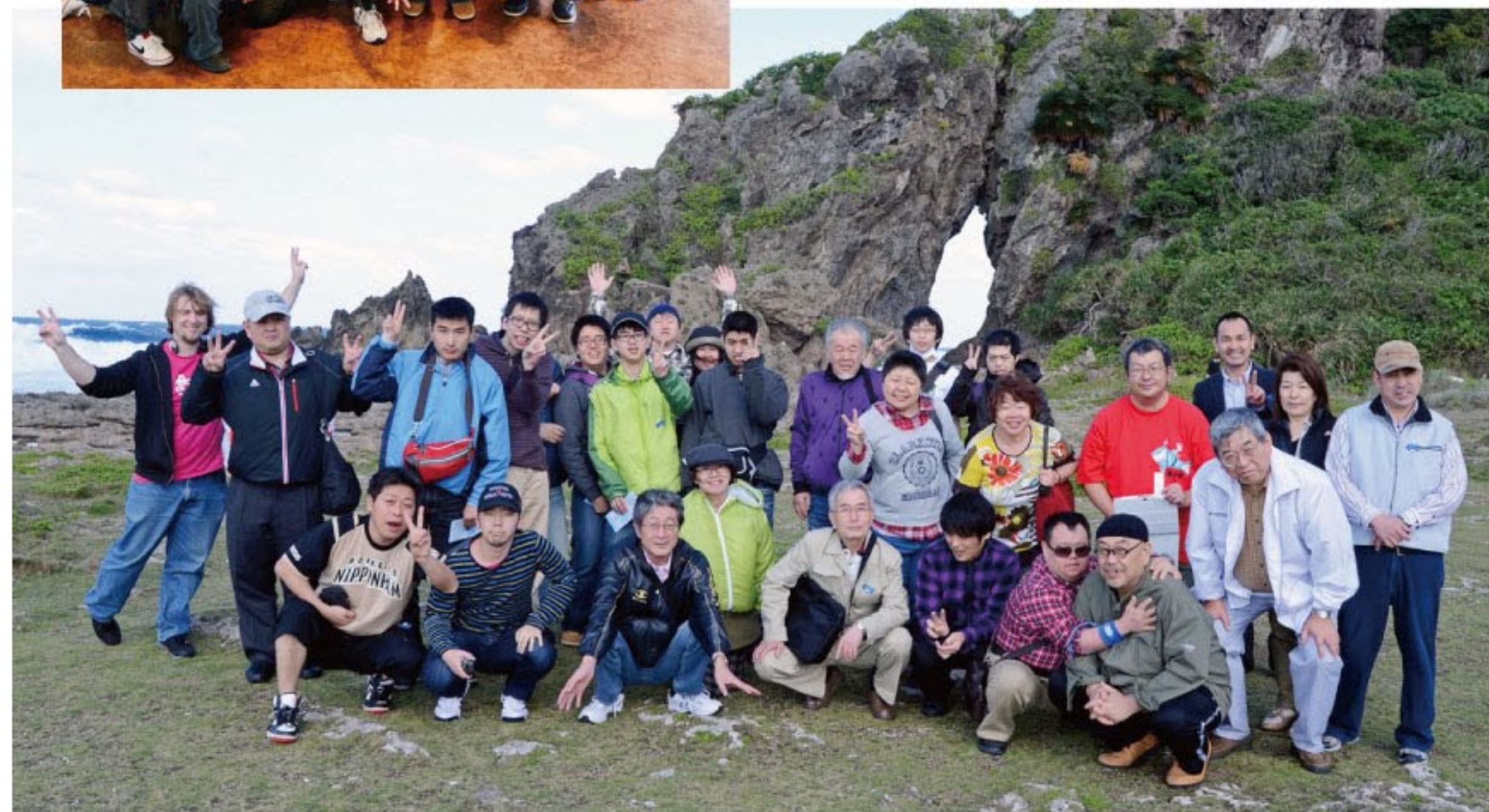
奇岩の景勝地「ミーフガー」にて