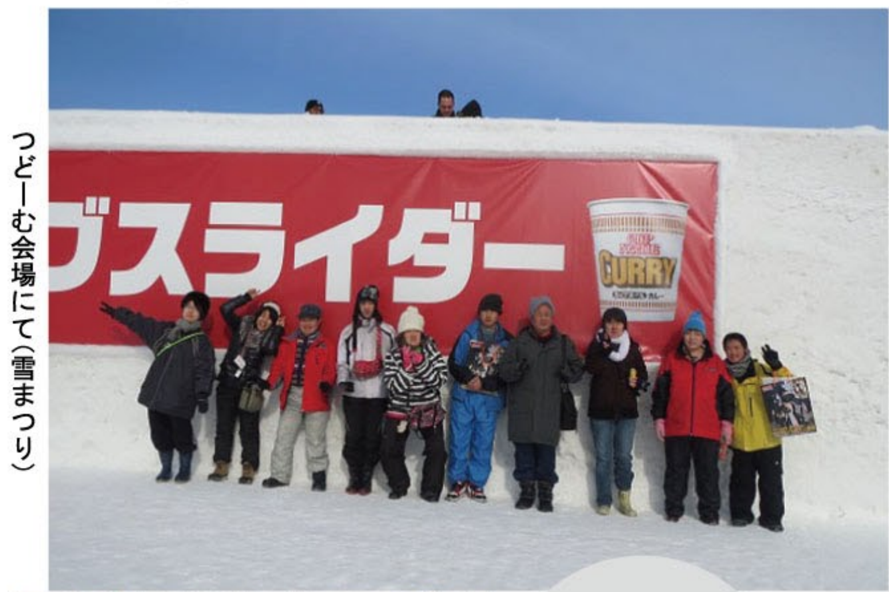
つどい会場にて(雪まつり)

2月3日から22日までの間、札幌協働福祉会の各事業所で1泊体験研修を行いました。 昨年と同様、仁木町「山の家きょうどう」に宿泊し、温泉や観光を満喫しました。 また、5日から11日まで札幌市東区の「つどいむ」で雪まつり、15日には拓北・あいの 里地区センターで「あいの雪まつり」が行われ、各事業所ではチューブすべりや雪像見学を 楽しみました。