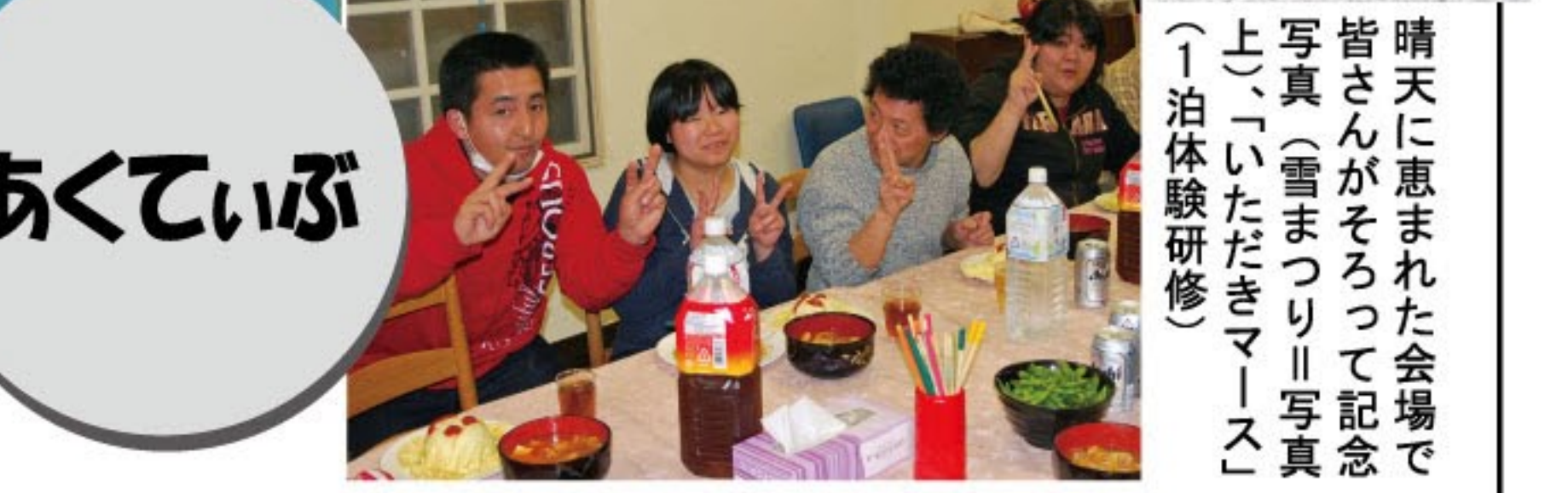
晴天に恵まれた会場で 皆さんがそろって記念 写真(雪まつり)写真 上、「いただきます」 (1泊体験研修)