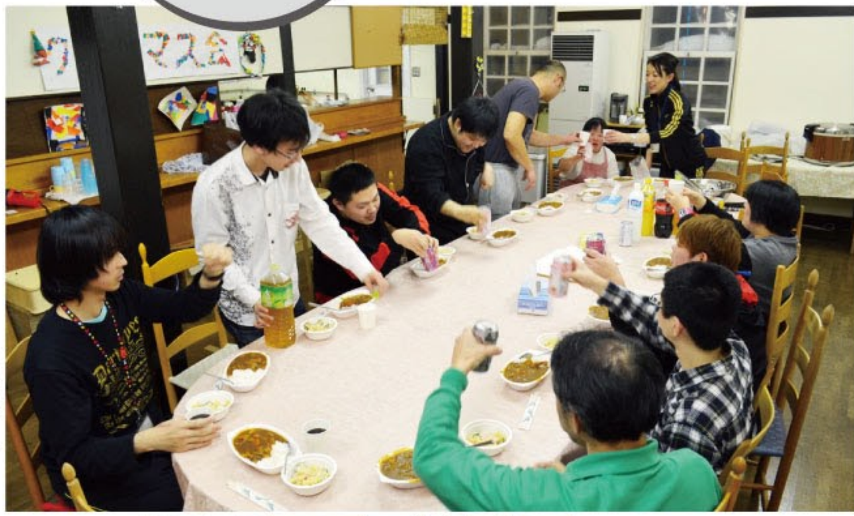
カンパニー！(1泊体験研修)