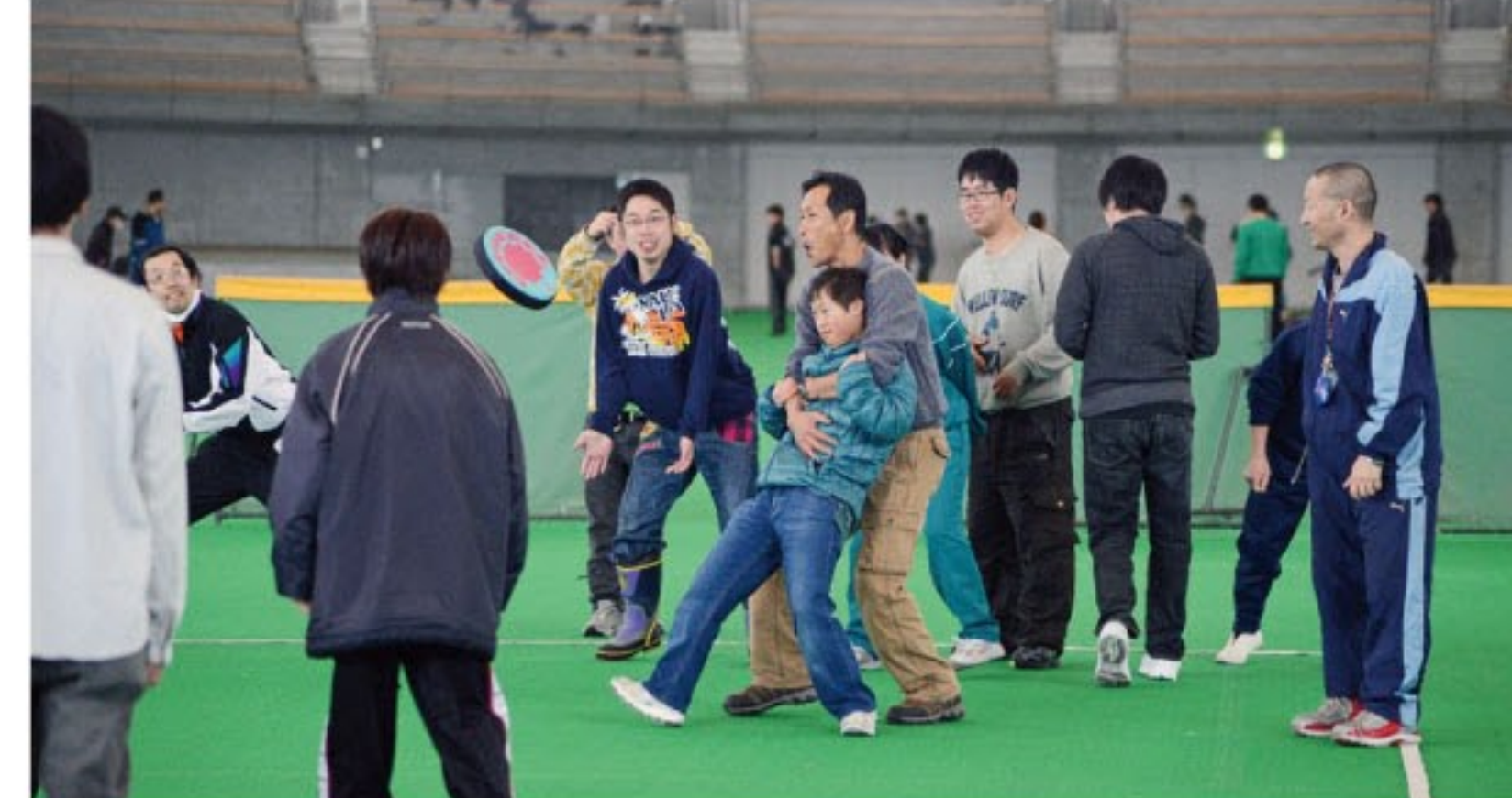
楽しい歓声が上がったドッチビー競技