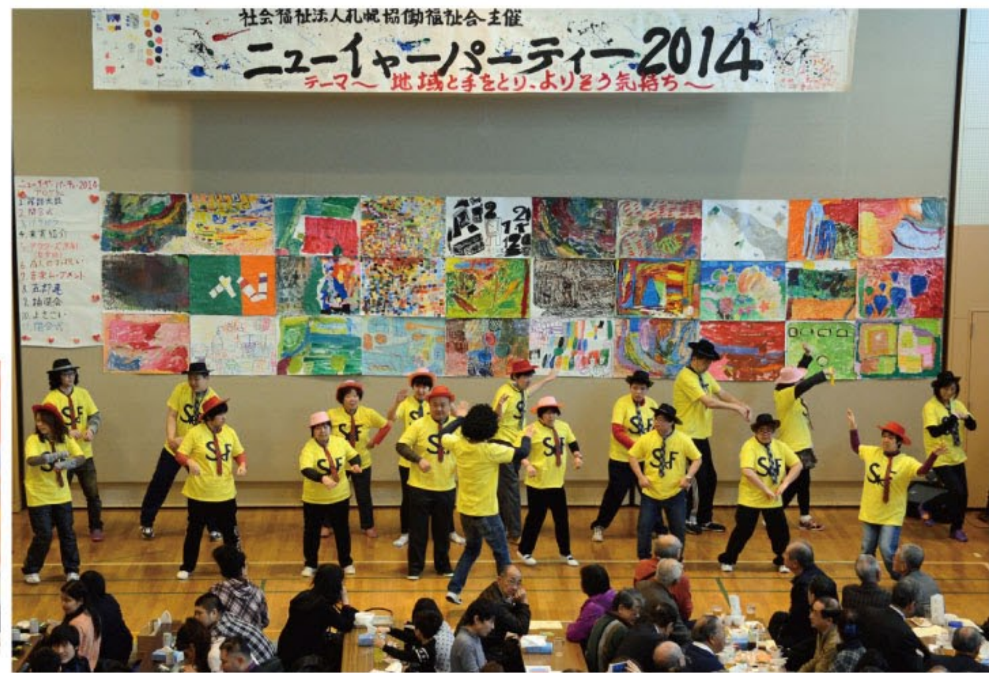
リズムに乗って「パラパラ」