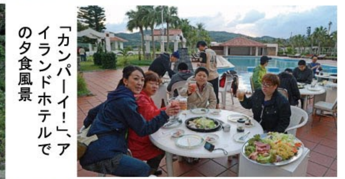
「カンパニー」アイランドホテルでの夕食風景