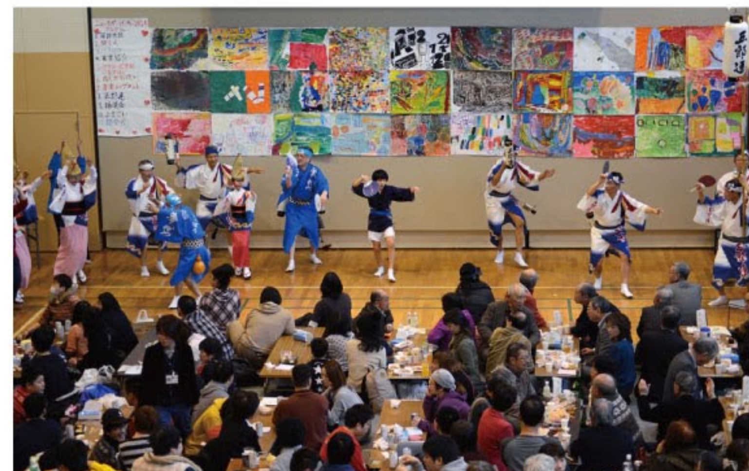
毎年恒例、五郎連による阿波踊り