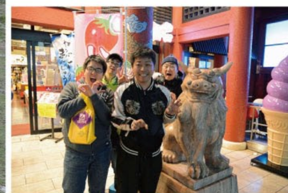
那覇市の国際通りにて