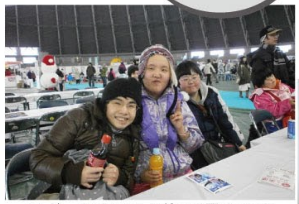
つどいむ内でひと休み(雪まつり)