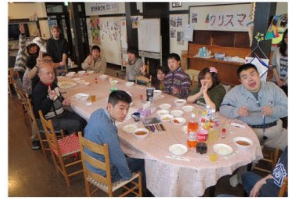
山の家での朝食風景(写真 真上、朝里川ゆきあかり の路見学(1泊体験研修))