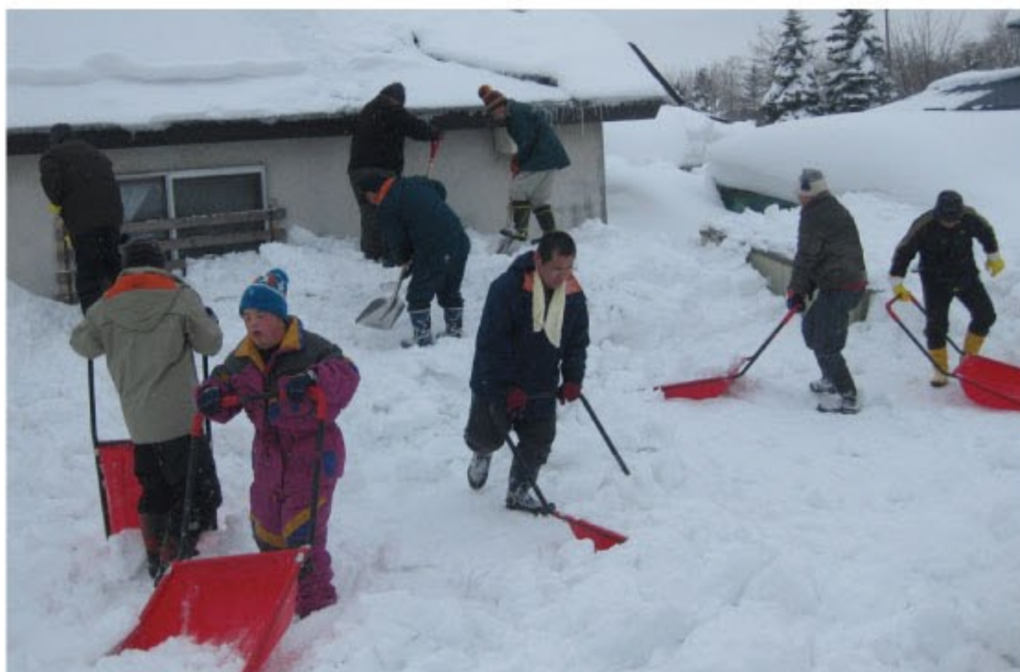
屋根からの落雪でふさがって しまった窓や玄関周りを除雪

現地での作業は、同行した社協スタッフの皆さんと協力して行うことができ、終了時には達成感に満ちた気持ち良い汗を流しました。