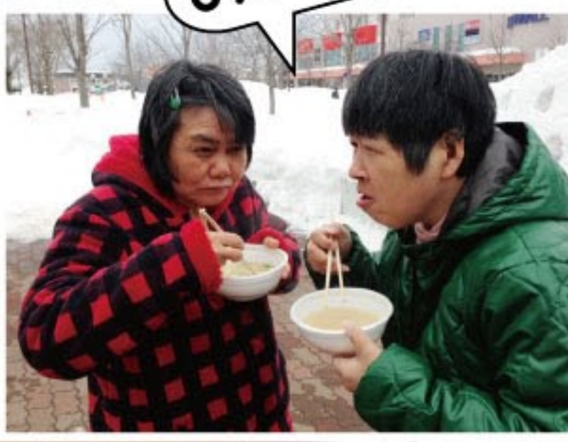
豚汁を食べている様子 (あいの雪まつり)