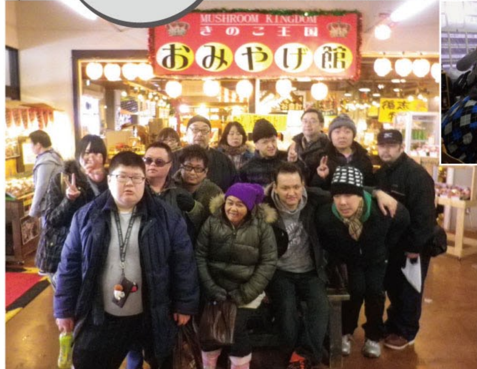
きのこ王国にて=写真左 山の家朝 (1泊体験研修)