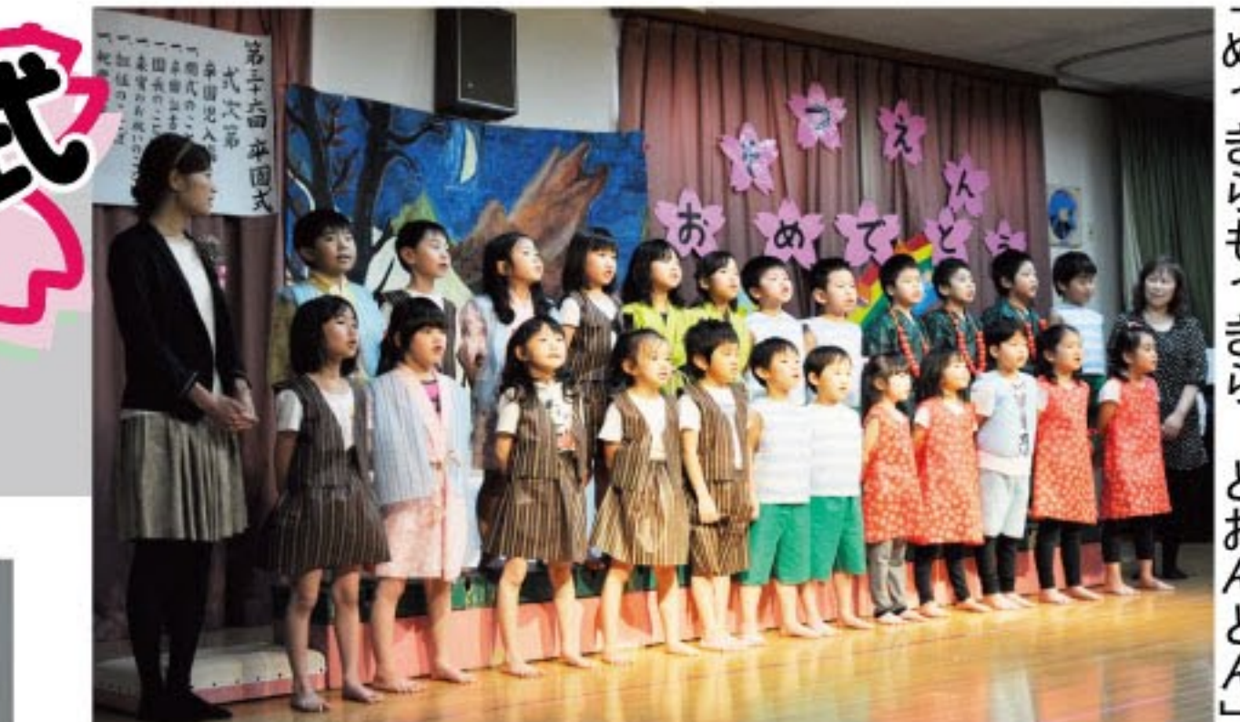
札幌協働保育園卒園児による「めつきらもつきら」とおんどん