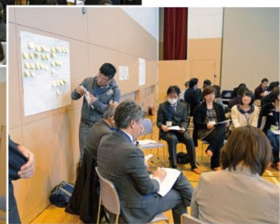
グループ討議の様子