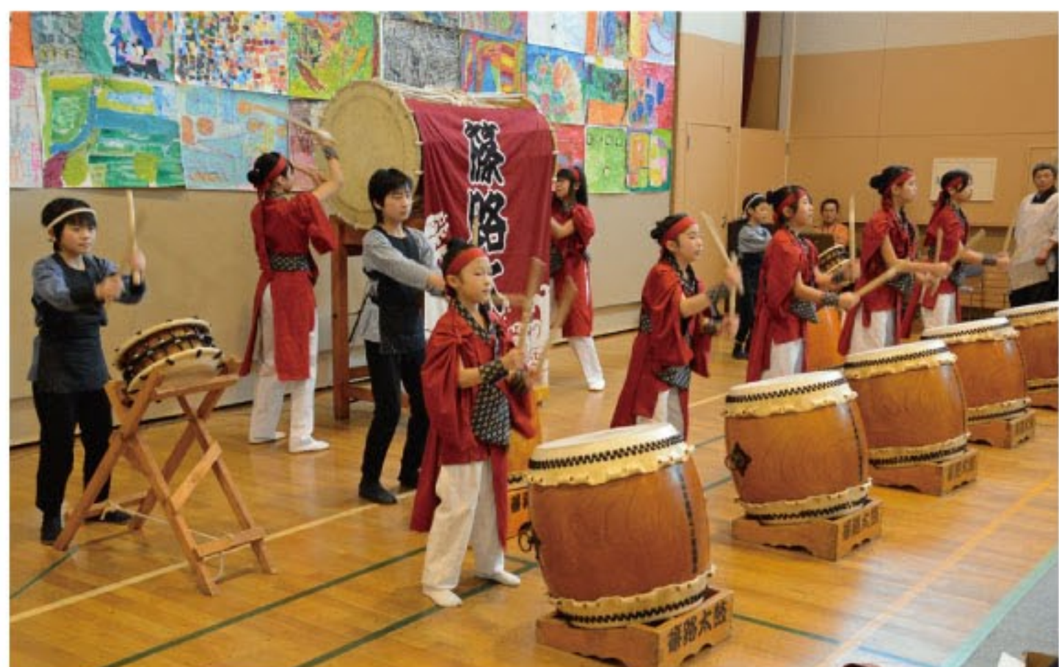
オープニングは篠路太鼓のみなさん