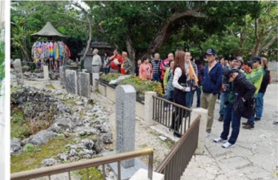
「ひめゆりの塔」を見学