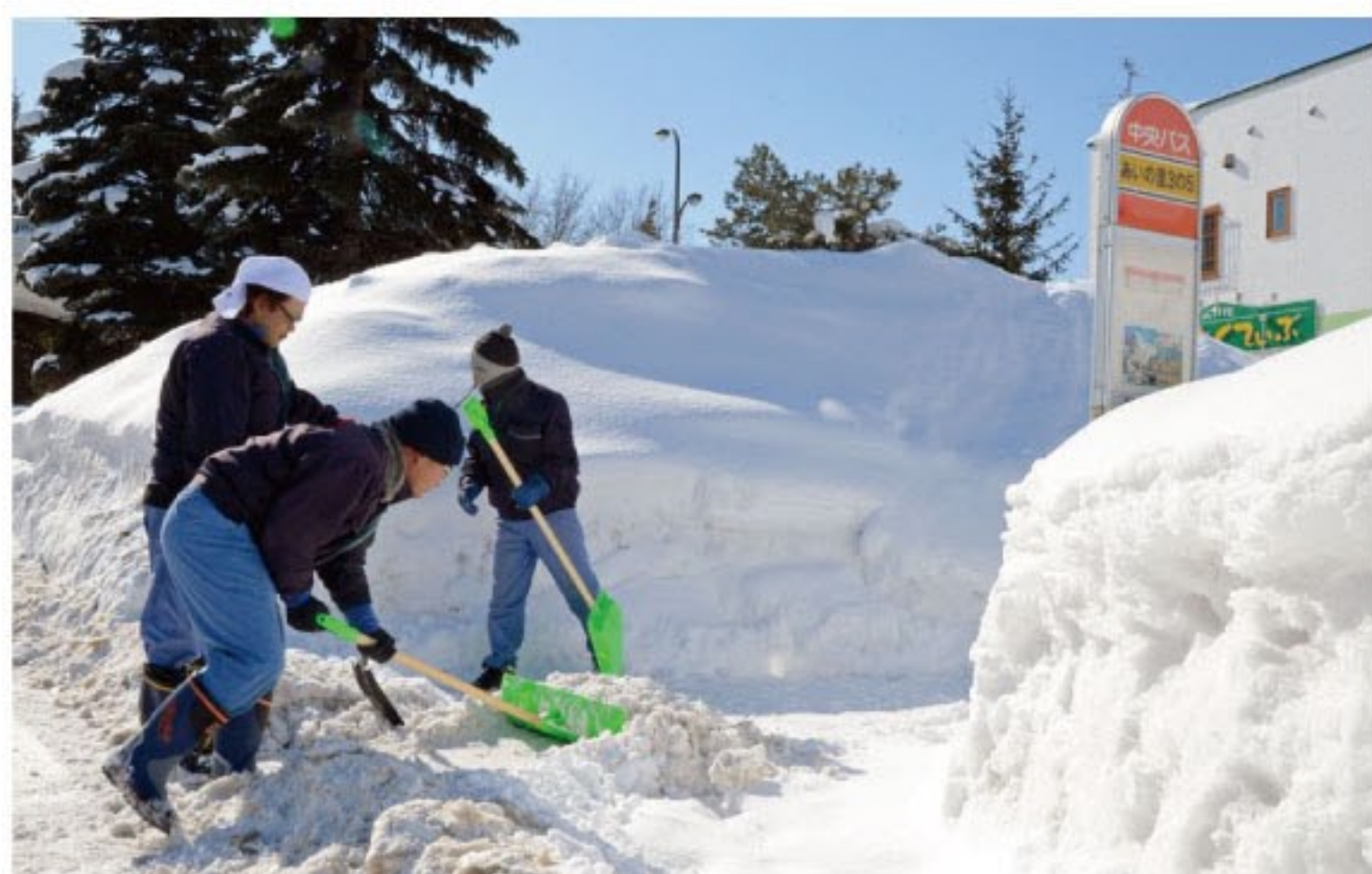
バス乗降時の安全のために 平らになるよう除雪作業

「あくていぶ・園芸班」では、通所時に利用するバス停、陸橋の除雪作業を行ないました。ショベルカーで寄せられた雪は重たいですが、皆さんでゆっくりと作業を進め、安全に乗降ができるように平らで広いスペースができました。