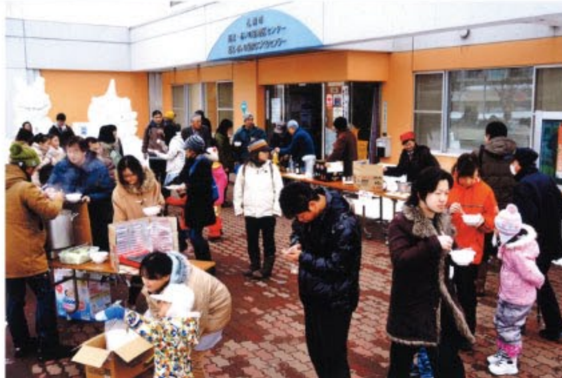
泡盛の試飲、豚汁などの 無料サービス。 体があたたまります。