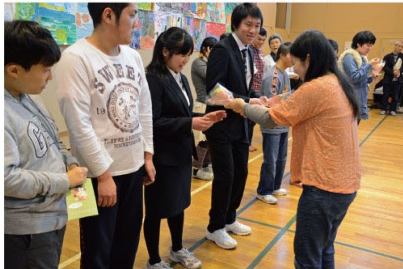
新成人の方へ花束贈呈