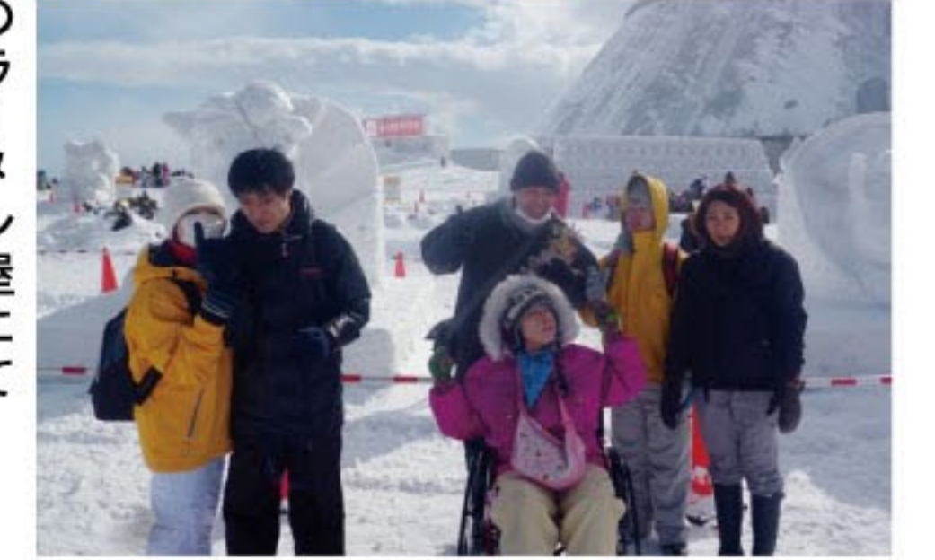
雪像の前で集合写真(雪まつり)