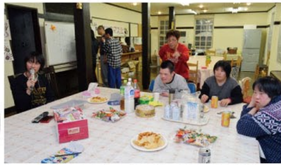
夕食後はカラオケタイム(1泊体験研修)