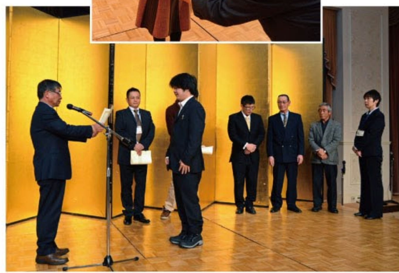
功労賞受賞の皆さん