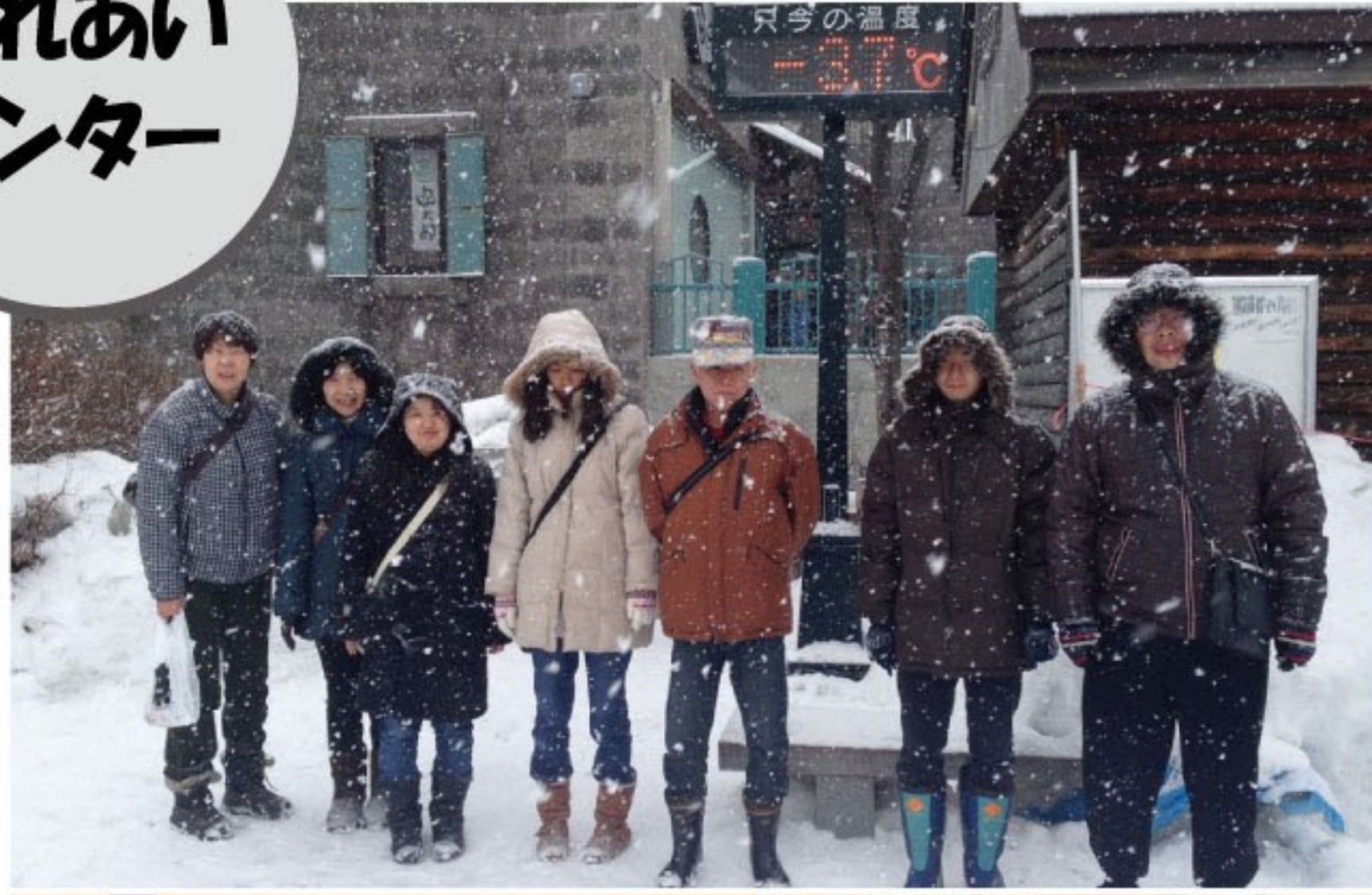
小樽運河でパシヤッ！記 念撮影(1泊体験研修)