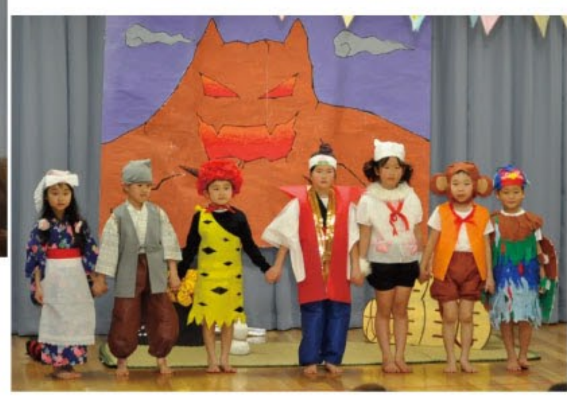
あいの里協働保育園卒園児による「桃太郎」