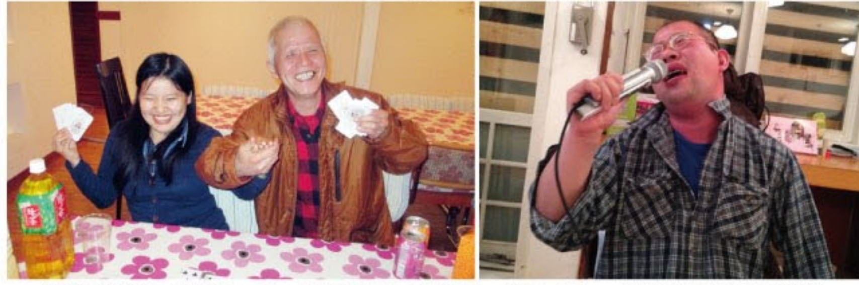
食後の楽しいゲーム=写真左、のんで~歌って~♪(1泊体験研修)