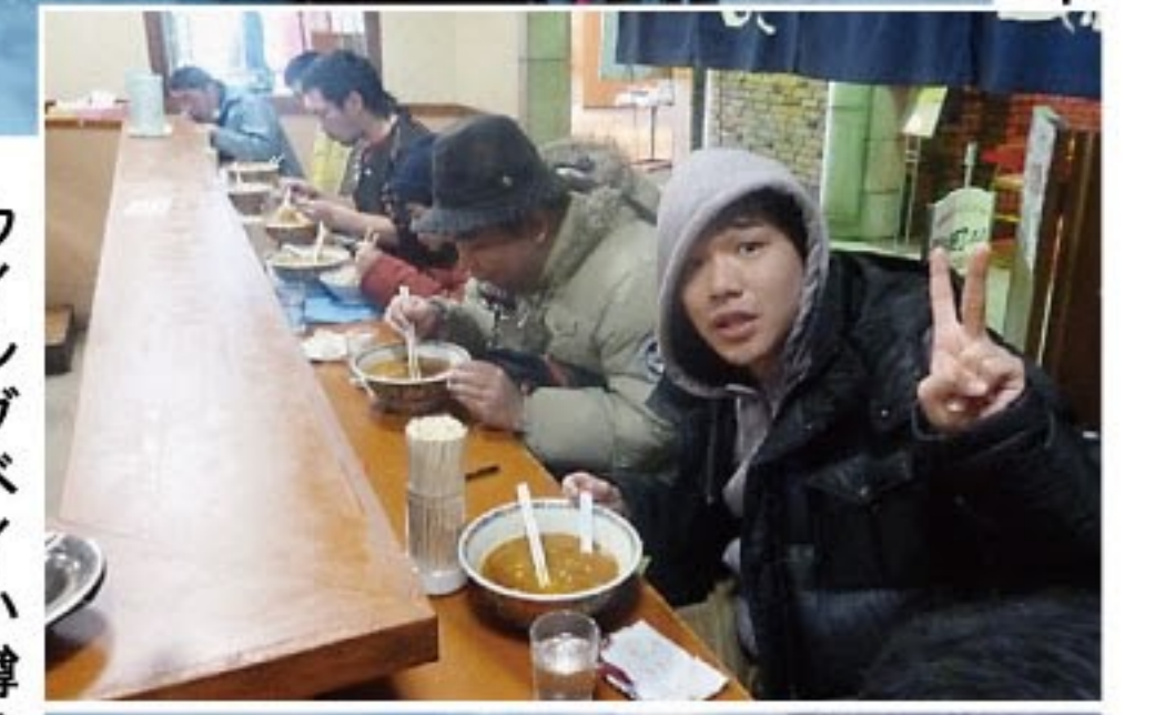
ウイングベイ小樽のラーメン屋にて (1泊体験研修)写真上、雪像をハッ クにポーズ！(雪まつり)