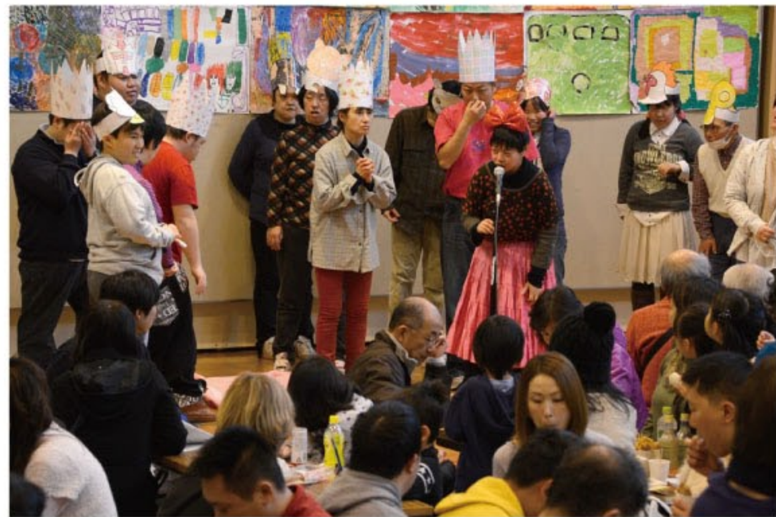
アクターズによる「しらゆき姫」