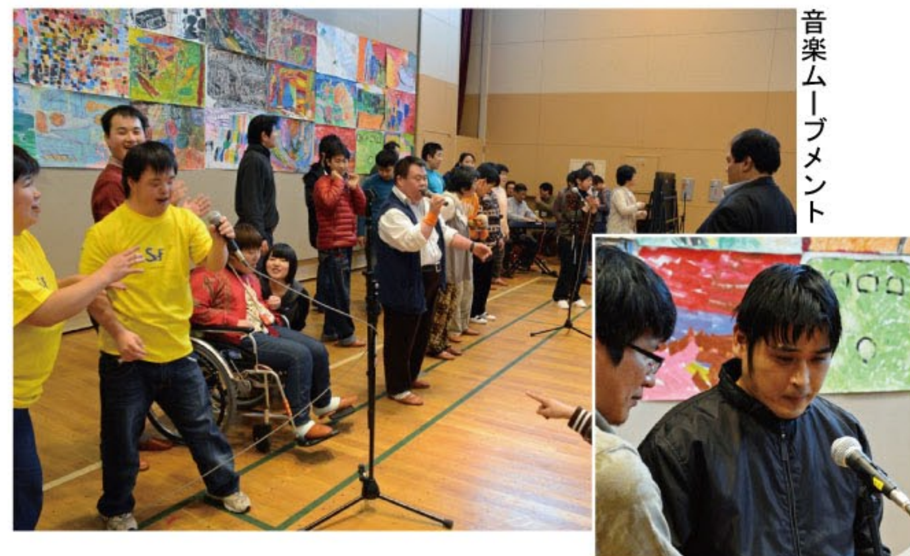
音楽ムーブメント