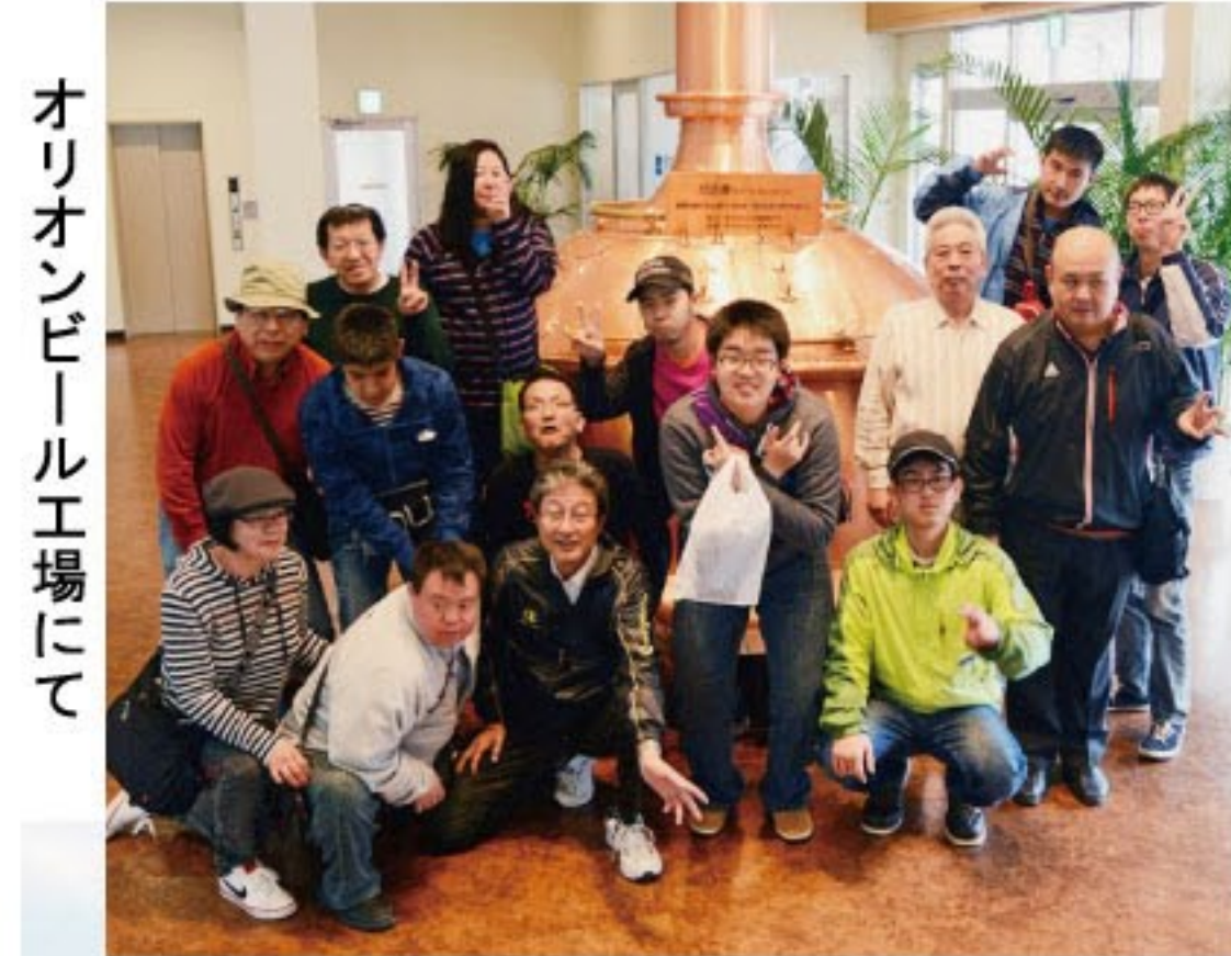
オリオンビール工場にて