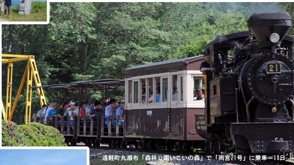
遠軽町丸瀬布「森林公園いこいの森」で「雨宮21号」に乗車=19日

■2014年7月19日(土) 余暇支援部が企画した「紋別・パークと釣り旅行」(19~21日)は2泊3日の日程で開かれました。旅行会は全日程が好天に恵まれオホーツクブルーの空の下、皆さんの楽しい笑顔があふれる旅行会となりました。