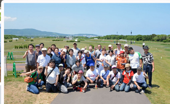
紋別市まきばの広場パークゴルフ場で=20日