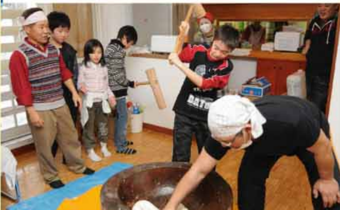
12/30 仁木町内の皆さんと「交流餅つき大会」