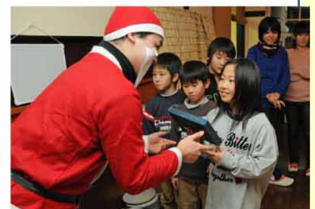
12/24 サンタさんからクリスマスプレゼント