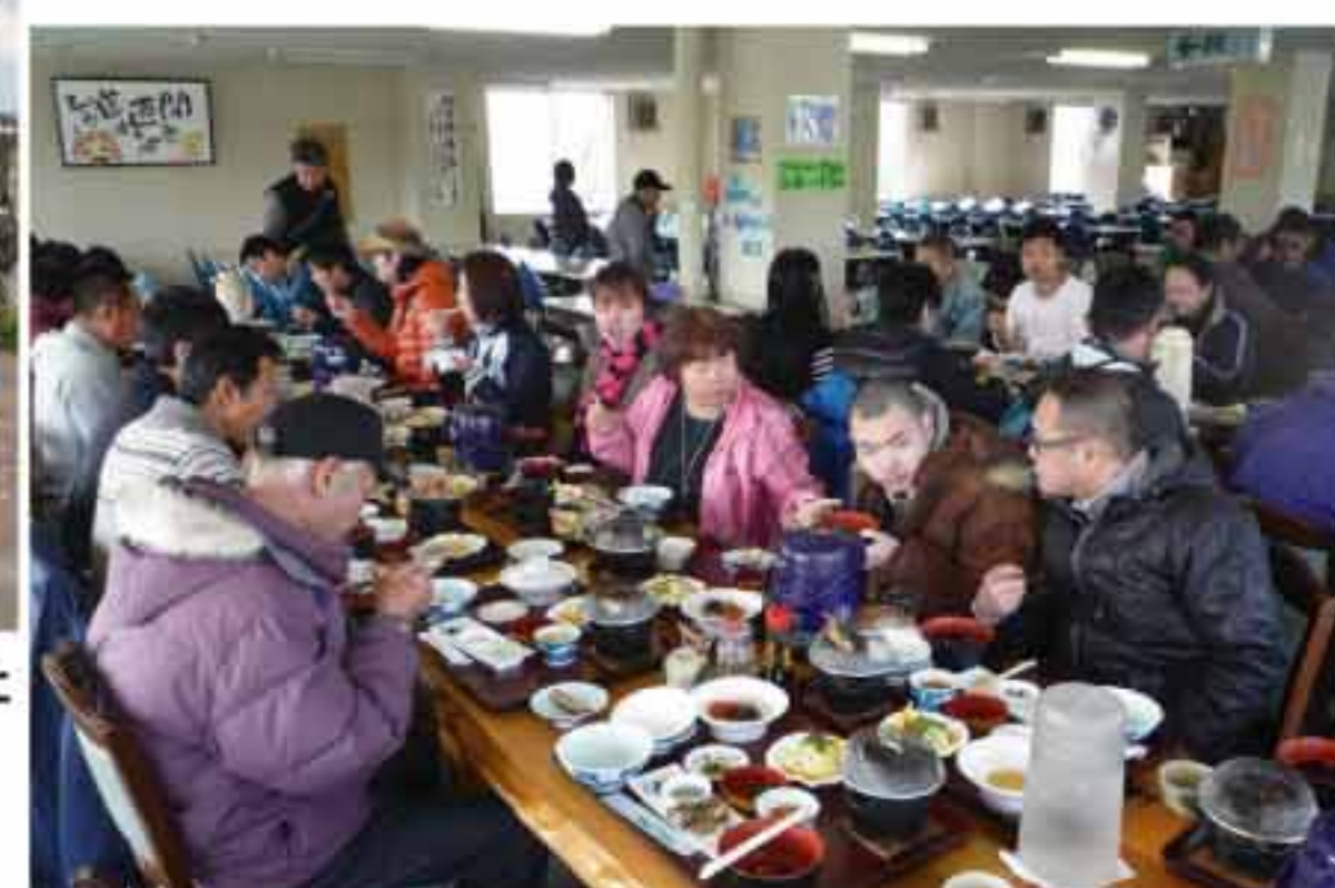
富川のドライブインにて昼食中