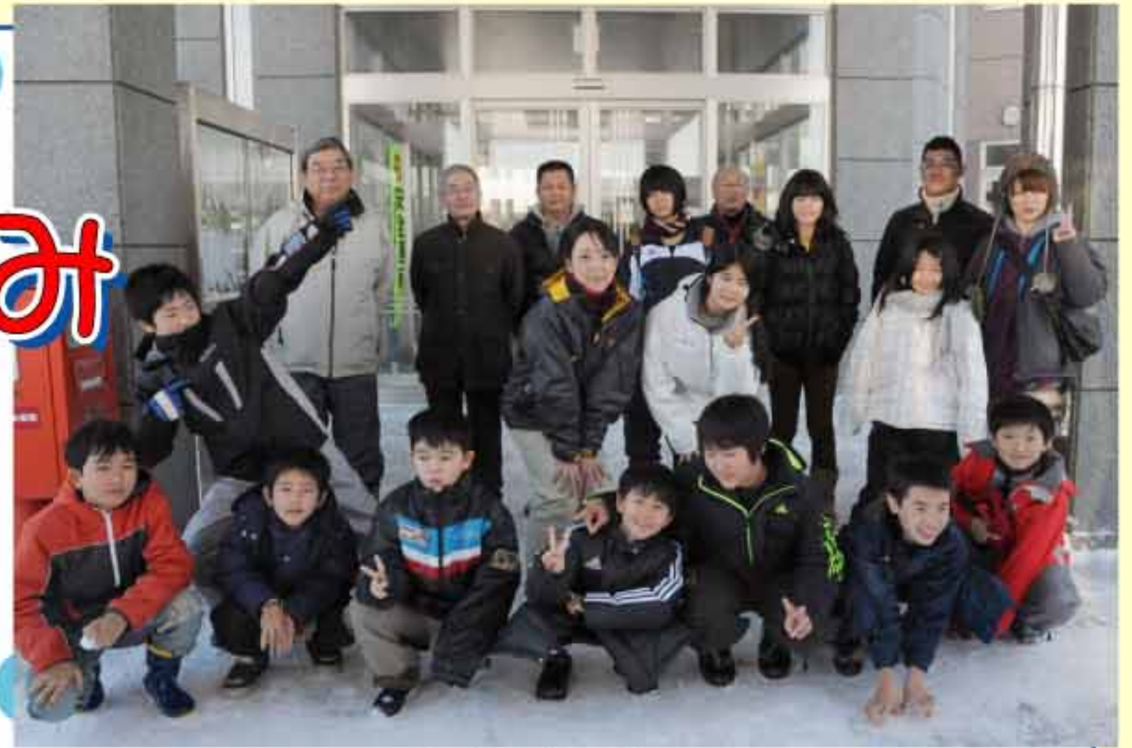
仁木町役場前にて