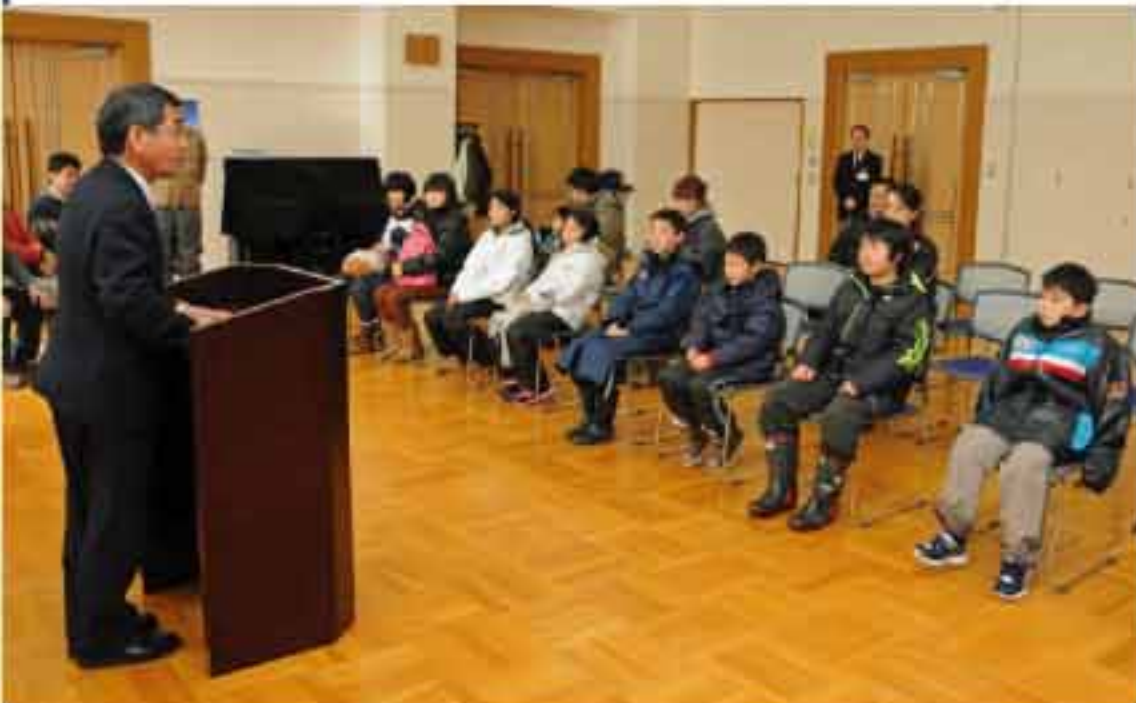
12/25 仁木町の三浦敏幸町長を表敬訪問