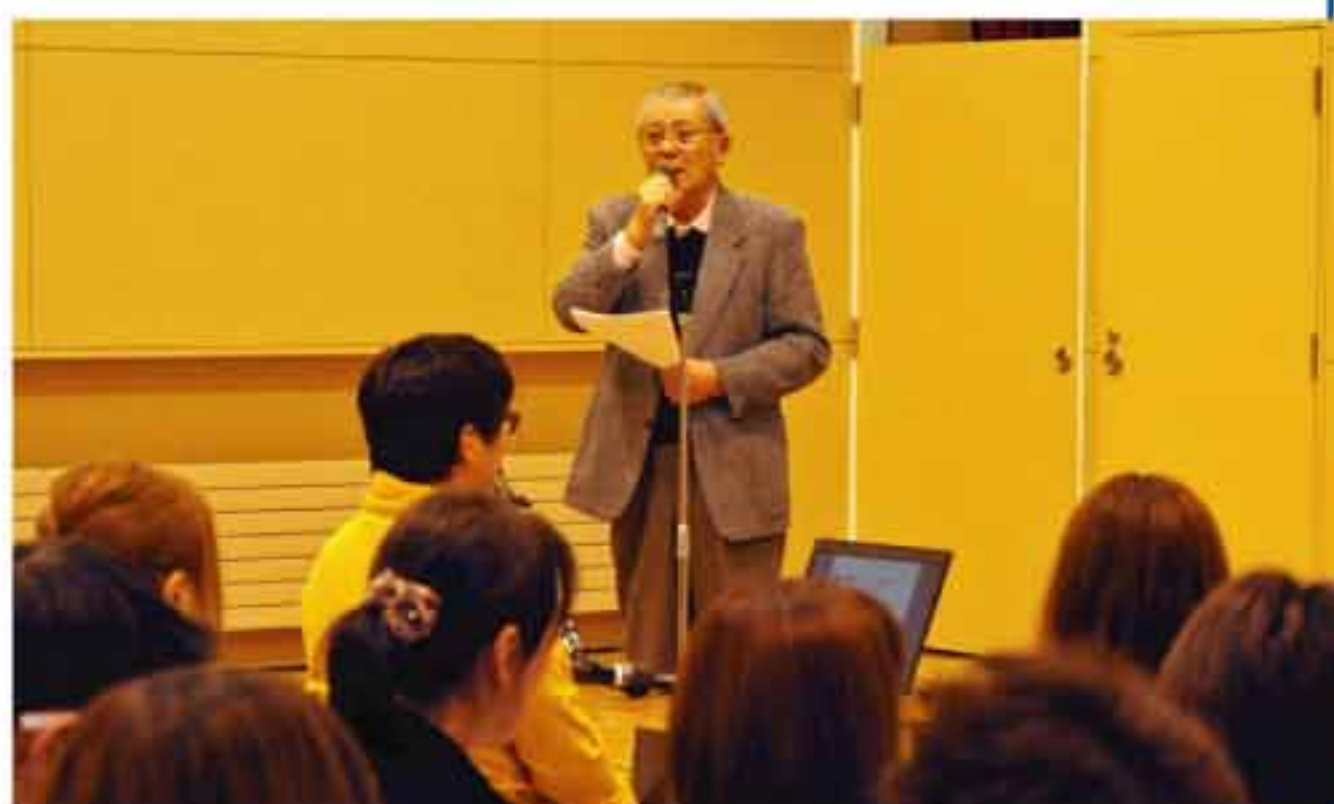
拓北・あいの里連合町内会松井会長の挨拶