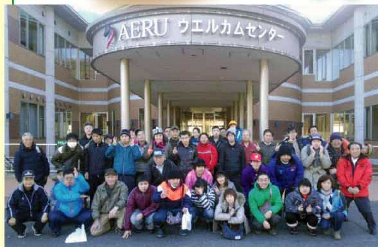
宿泊したホテル「うらかわ優駿ビレッジAERU」前にて

各地から本格的な雪の便りも届くこの時期、昨年に続き今年も釣りとパークゴルフを楽しむ旅行会が初冬の日高路を舞台に開かれました。