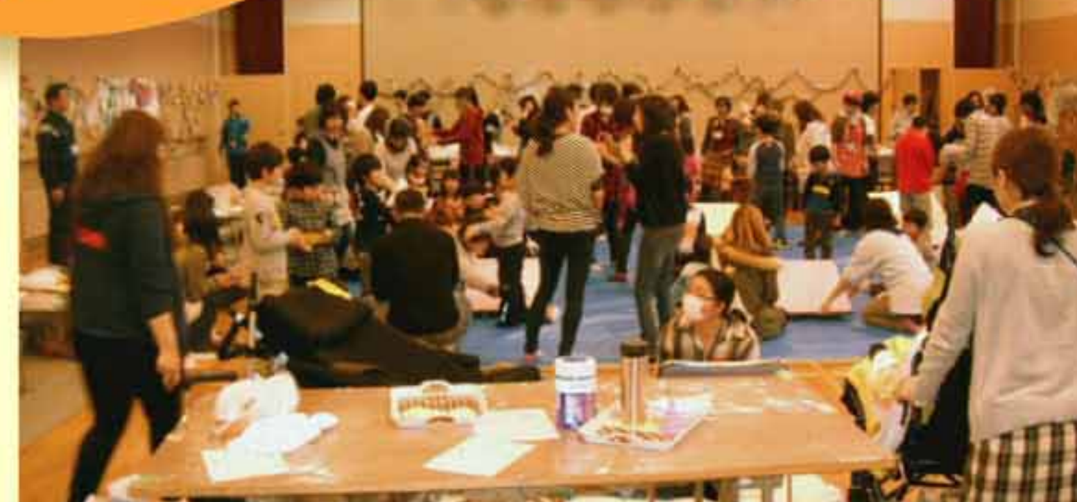
今年のテーマは アイスクリーム作り！

会場には、父母や祖父母の方など約120名の参加があり、大変賑やかな交流会となりました。