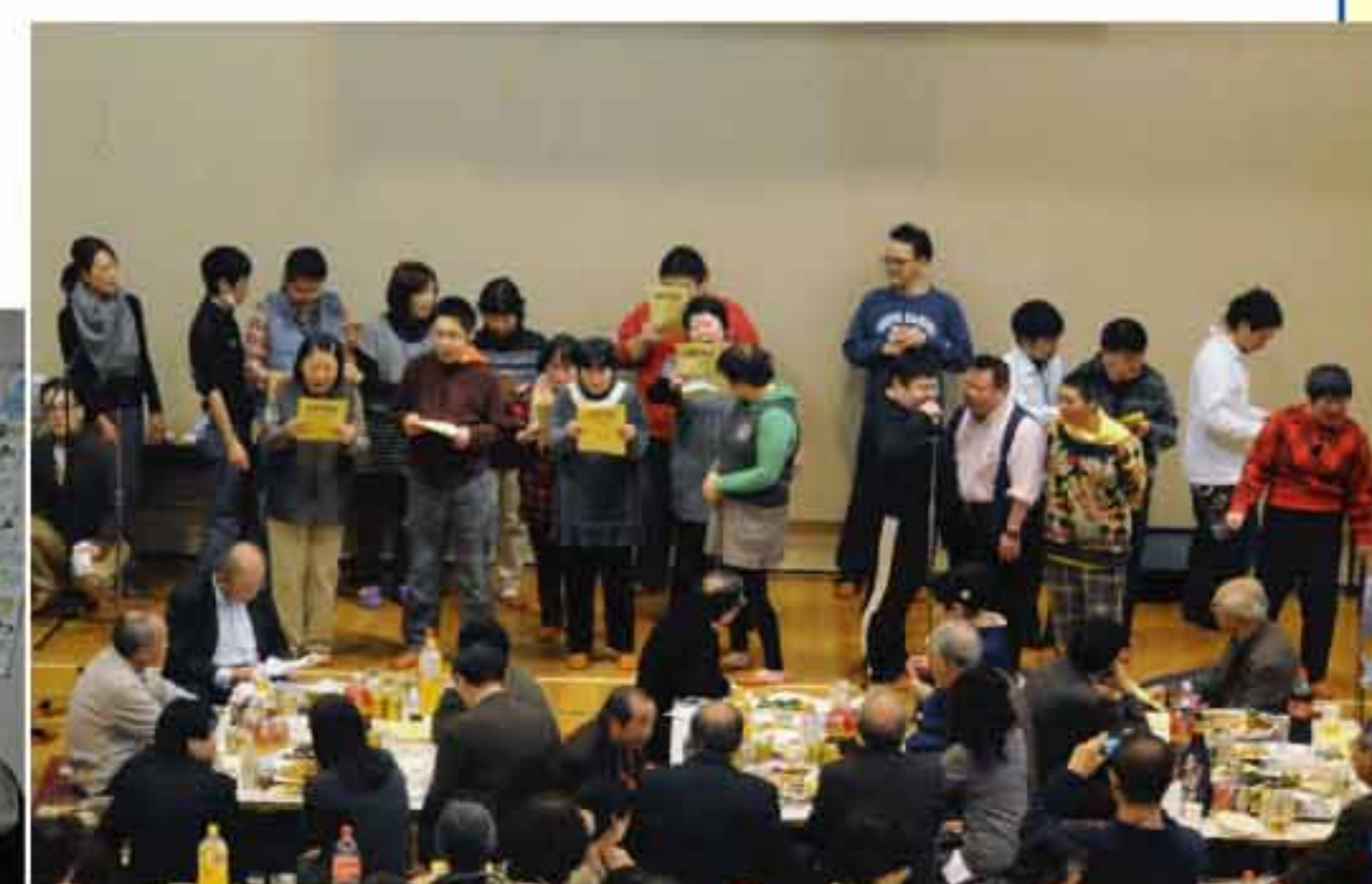
みんなで「たんぽぽ畑はないけれど」を合唱♪