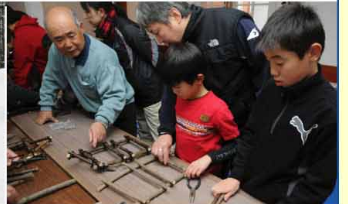
12/25 かんじき作りを体験