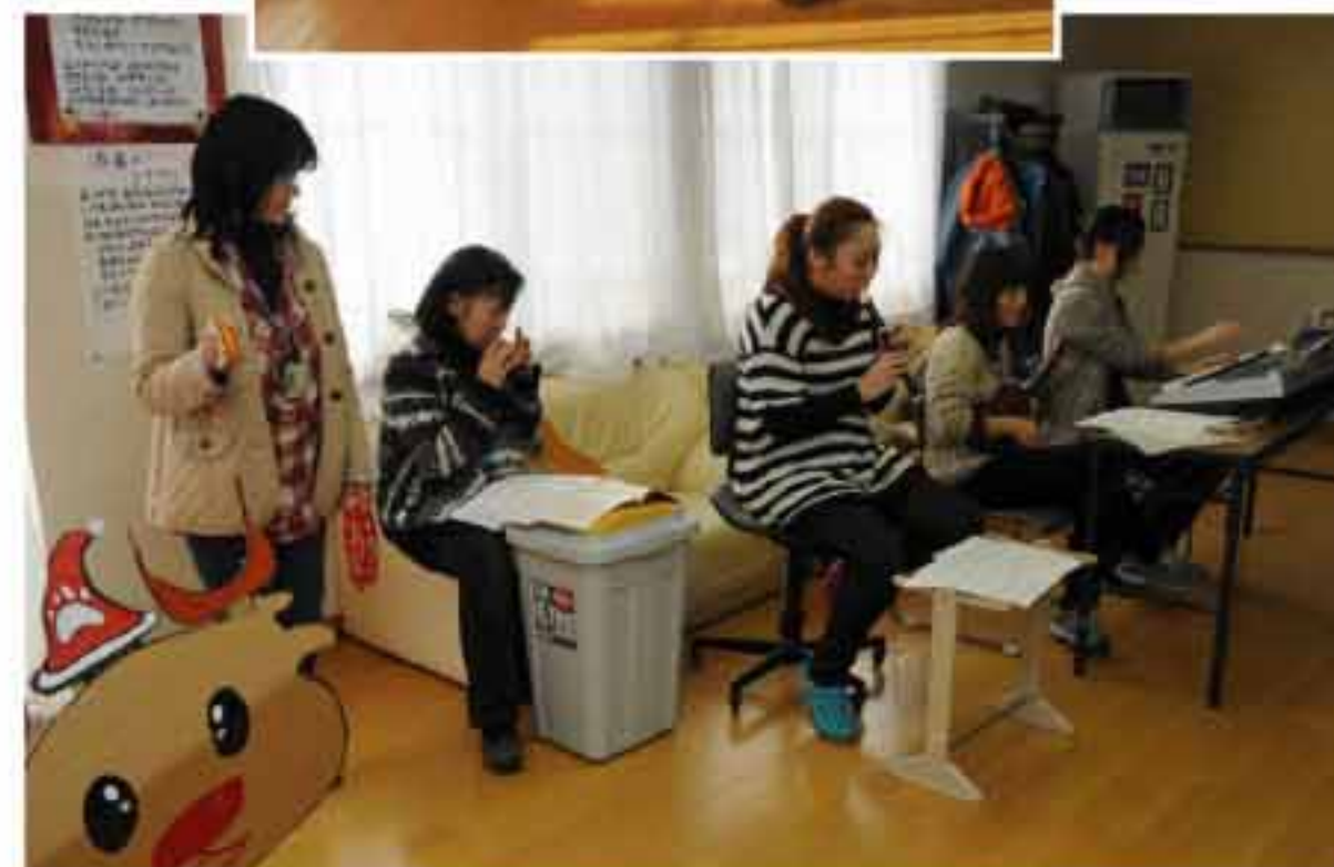
自称「女子会…？」のメンバーが 編成した「ガールズバンド…？」が パーティーを盛り上げました。