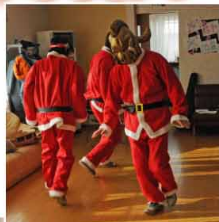
サンタクロースが3人…？ 不思議な踊りを披露した 男性スタッフ