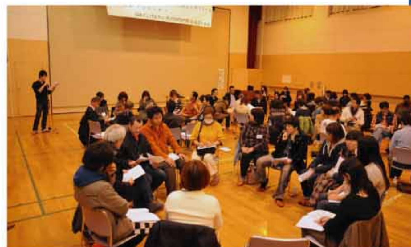
事例をもとにグループ討議、発表が行われました