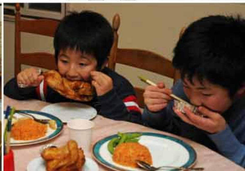
12/24 クリスマスのご馳走を食べる子どもたち