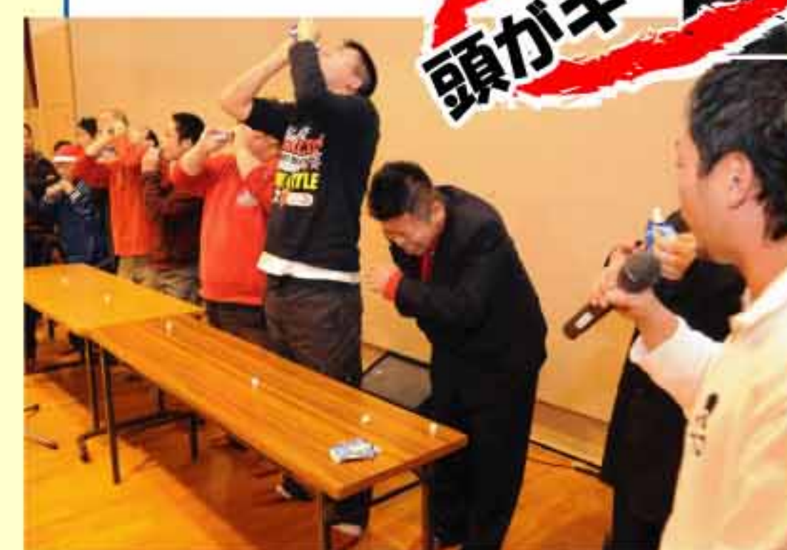
白熱したアイスの早食い競争