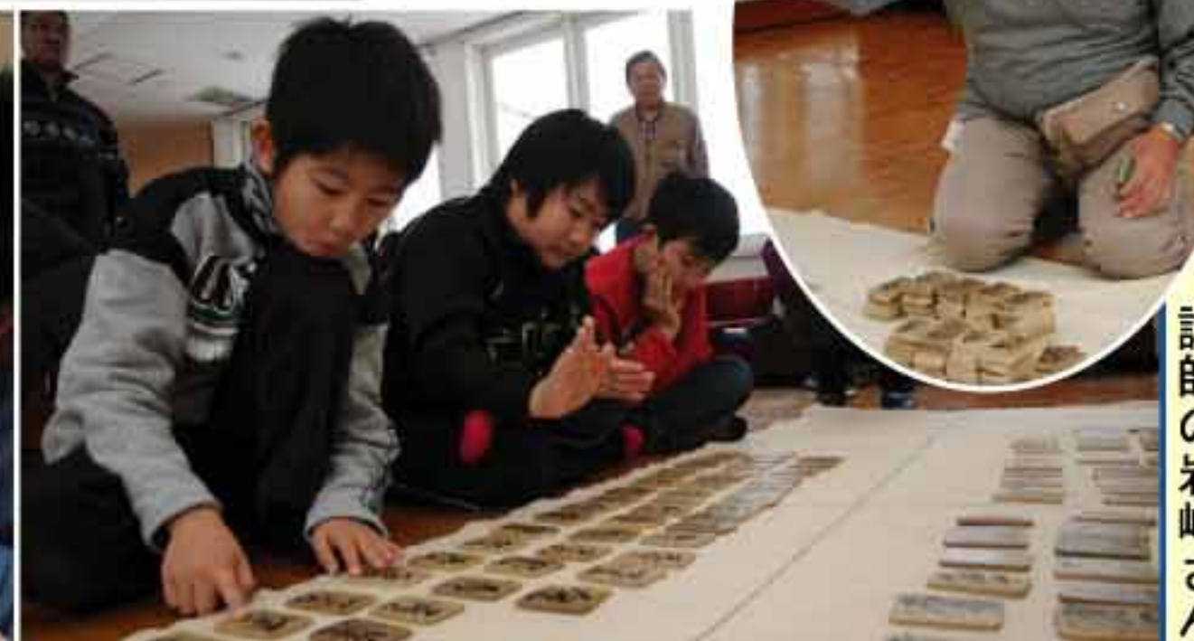
12/26 百人一首かるた会