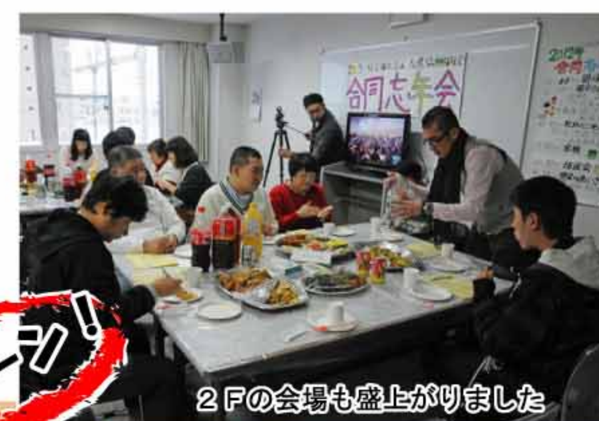
2Fの会場も盛り上がりました

今回も父母の皆さん、地域の皆さんが大勢ご参加くださり、会場内は楽しい笑い声や明るい歌声が溢れ、賑やかな内に進行了しました。