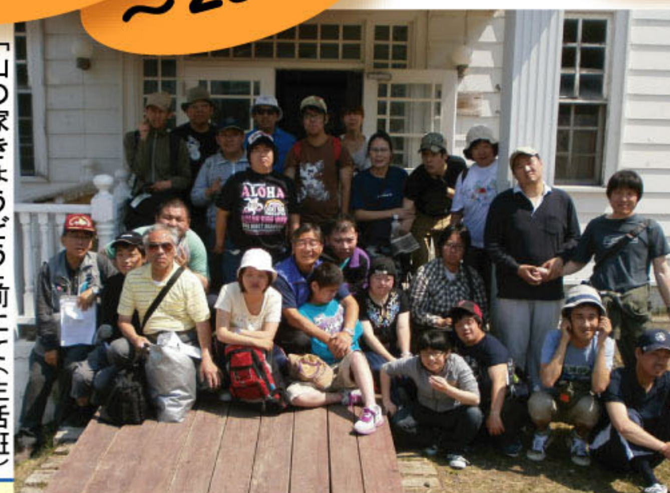
「山の家きょうどう」にて(生活班)