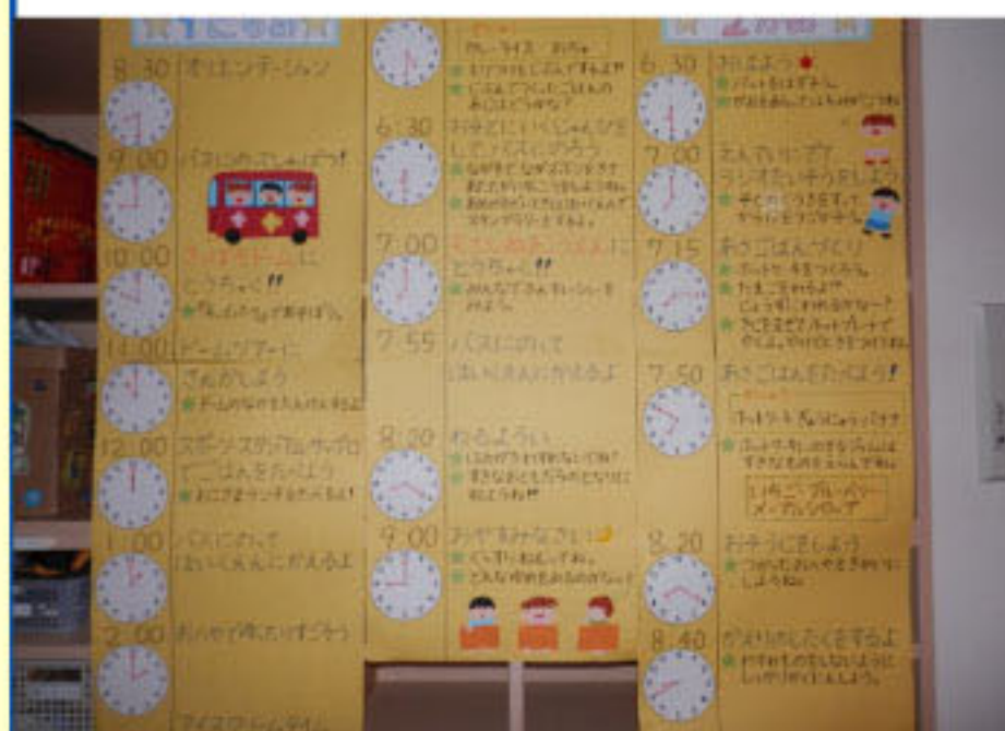
お部屋に貼ったタイムスケジュール