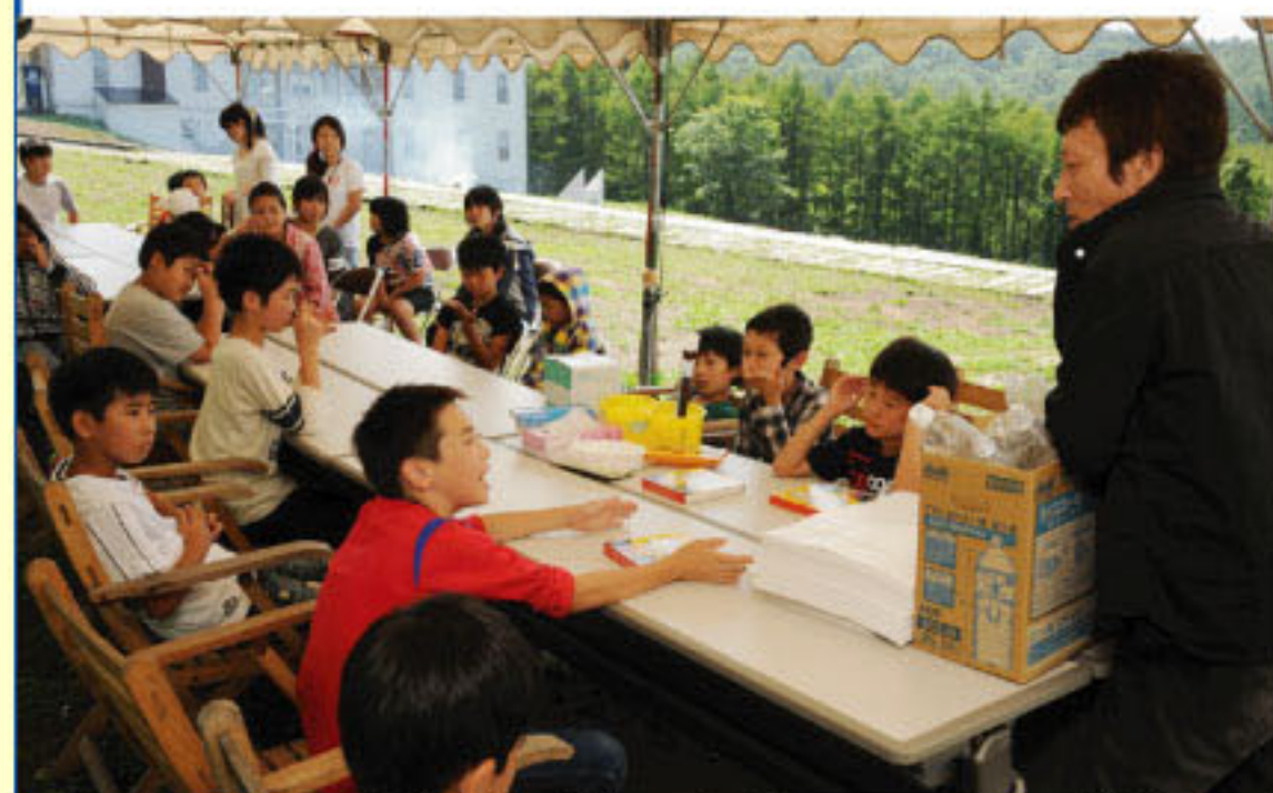
8/3 碓井画伯によるアートな時間