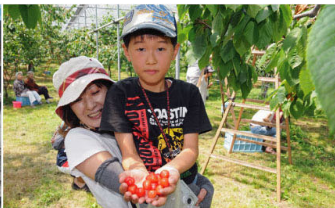
7/26 さくらんぼ狩りを体験