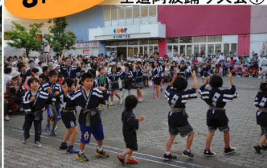
全道阿波踊り大会②