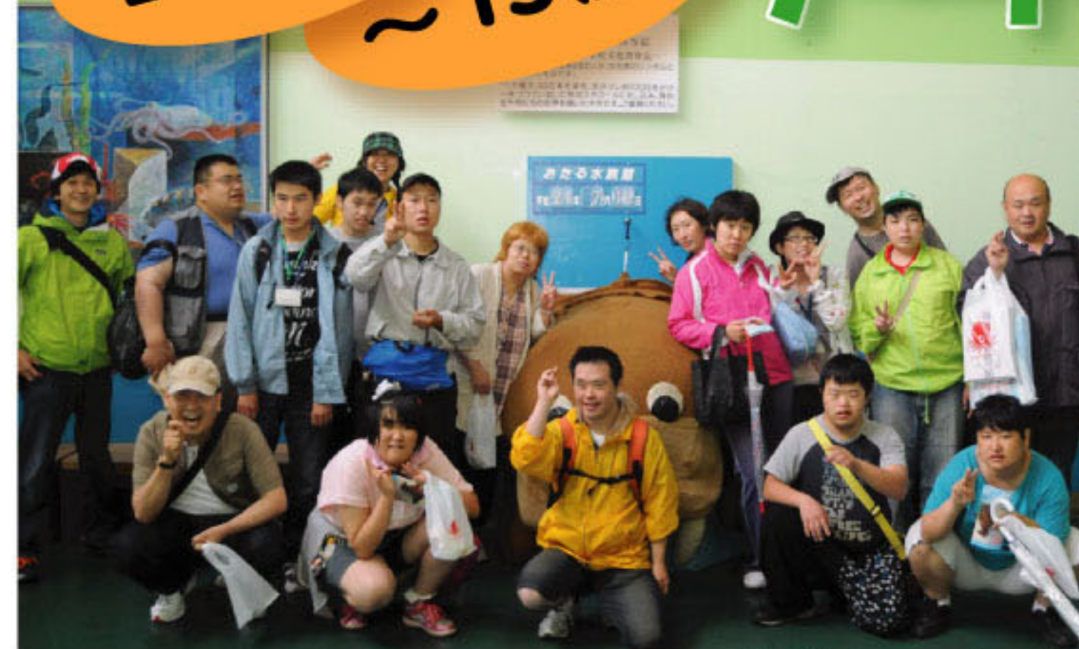
小樽水族館で記念写真