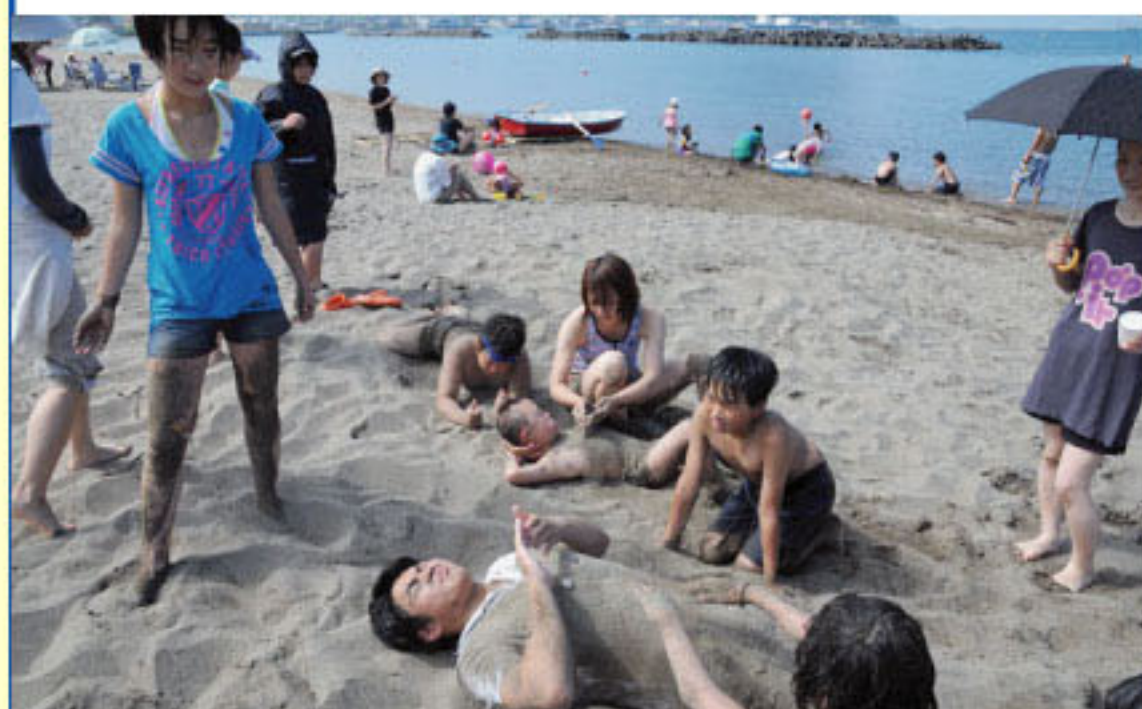
7/26 余市町浜中で海水浴②