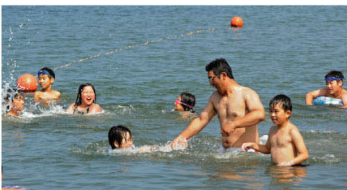
7/26 余市町浜中で海水浴①