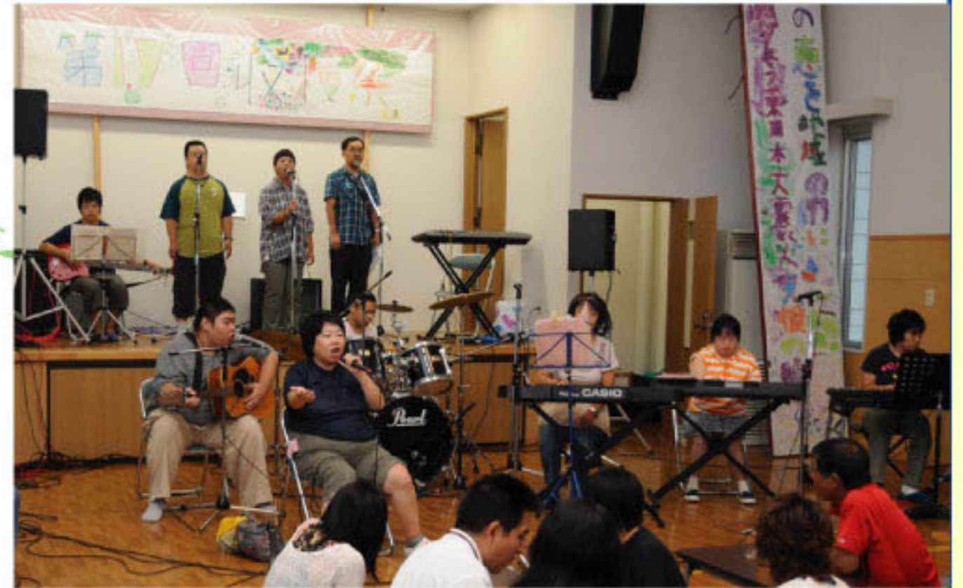
昨年 は雨 の中 、大 勢の 方に 来 て 頂 き ま し た

皆様方と食べたり歌ったり踊ったりと一緒に楽しめるよう準備を進めておりますので、お気軽にお越しください!