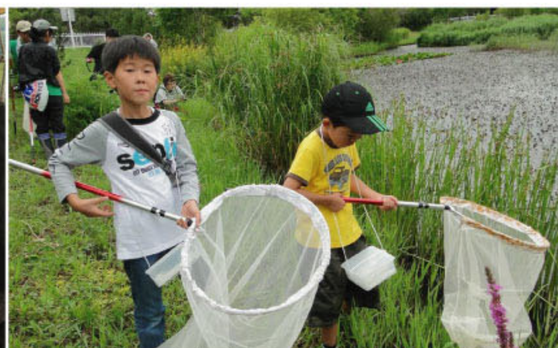
8/5 「カラカネイトトンボを守る会」と昆虫採集