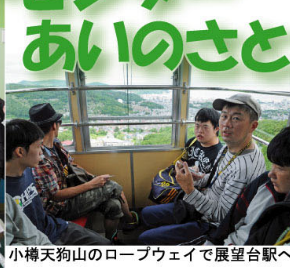
小樽天狗山のロープウェイで展望台駅へ