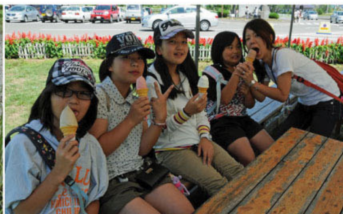
8/8 京極町ふきだし公園にて