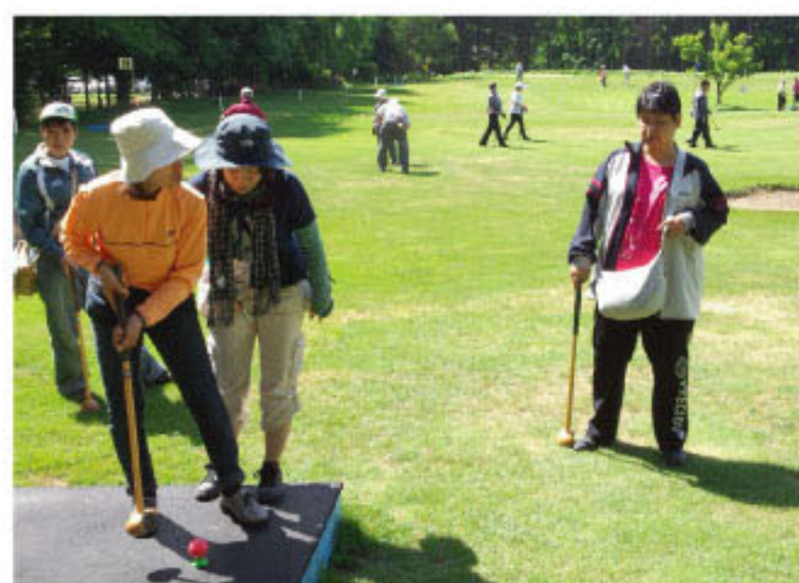
パークゴルフを楽しむ皆さん

15日は、パーク組の皆さんは留辺蕊町の「あいりすパークゴルフ場」でプレーを楽しみ、釣り組の皆さんは、観光砕氷船ガリンコ号で大きなカレーやカジカ等を船上から釣り上げていました。