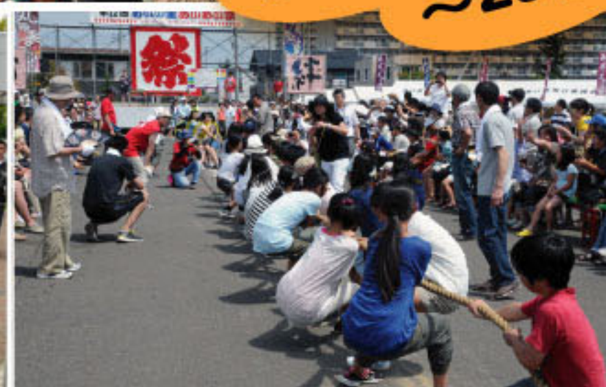
あいの里 あいあい祭②