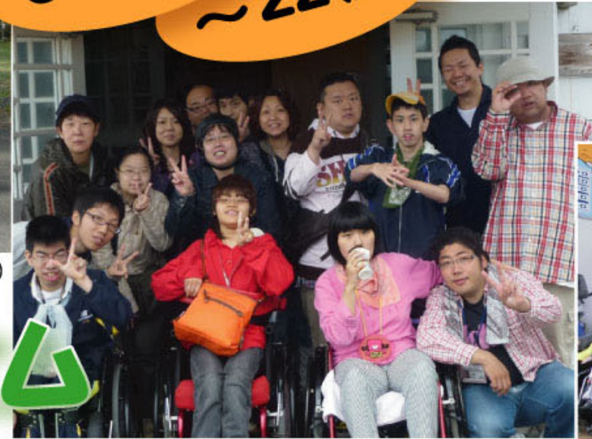
「山の家きょうどう」にて(第1班)