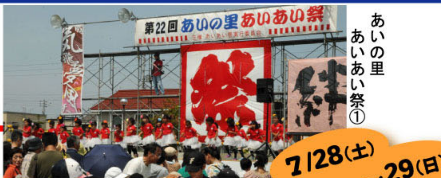
あいの里 あいあい祭①