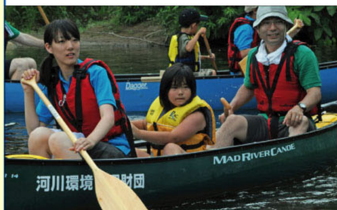
7/31 余市川をカヌーで川下り