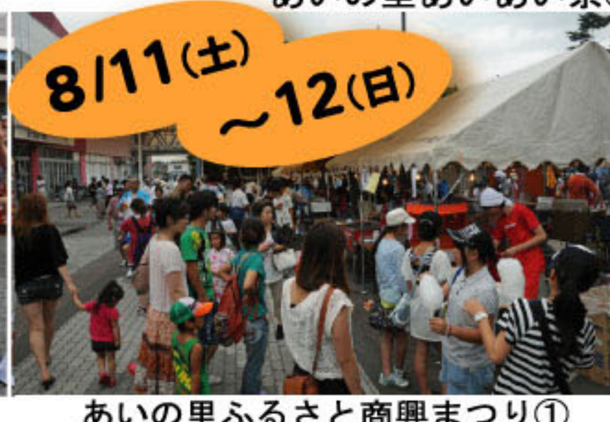
あいの里ふるさと商興まつり①