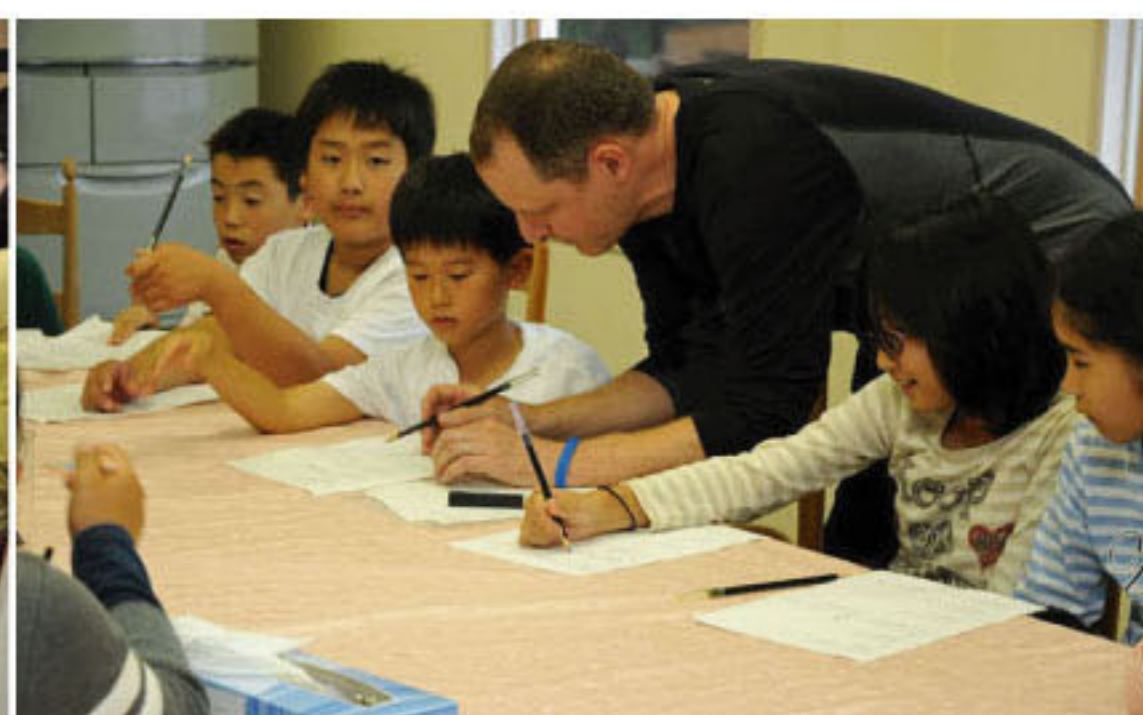
8/1 マーク先生の英会話教室