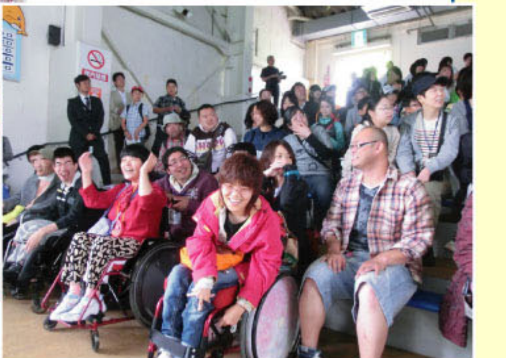
小樽水族館でセイウチやイルカショーを見学