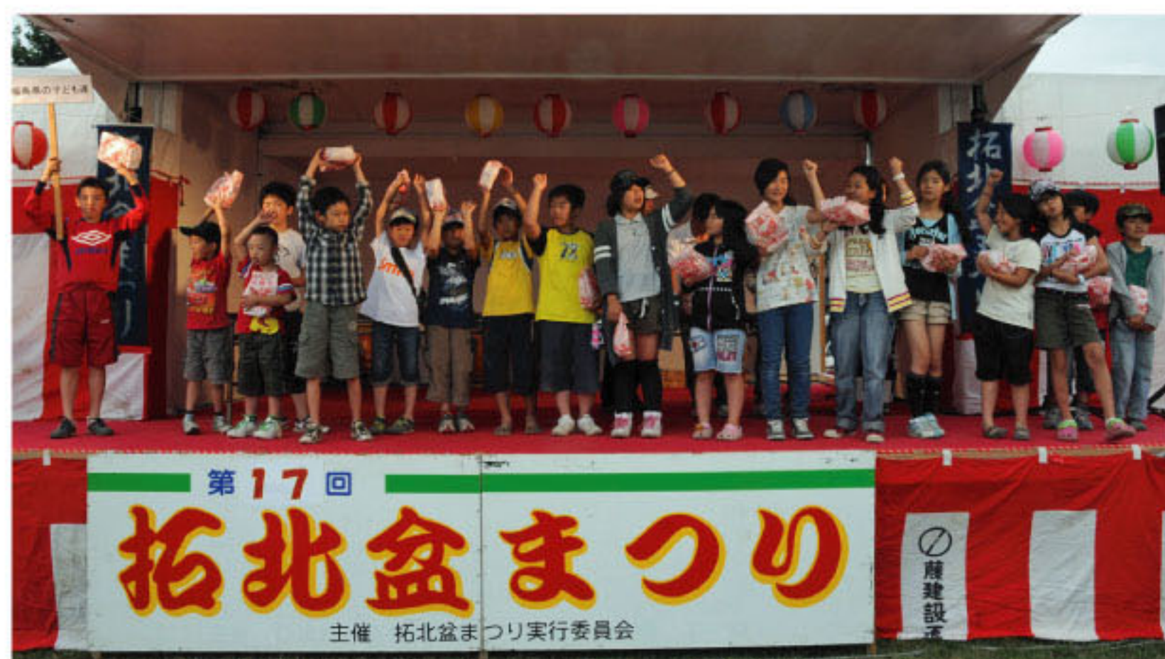
8/4 拓北盆まつりで「PK町内会対抗」見事に優勝！