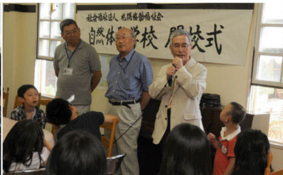
7/23 自然体験学校開校式