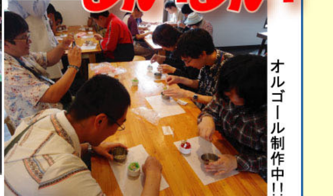
オルゴール制作中!!