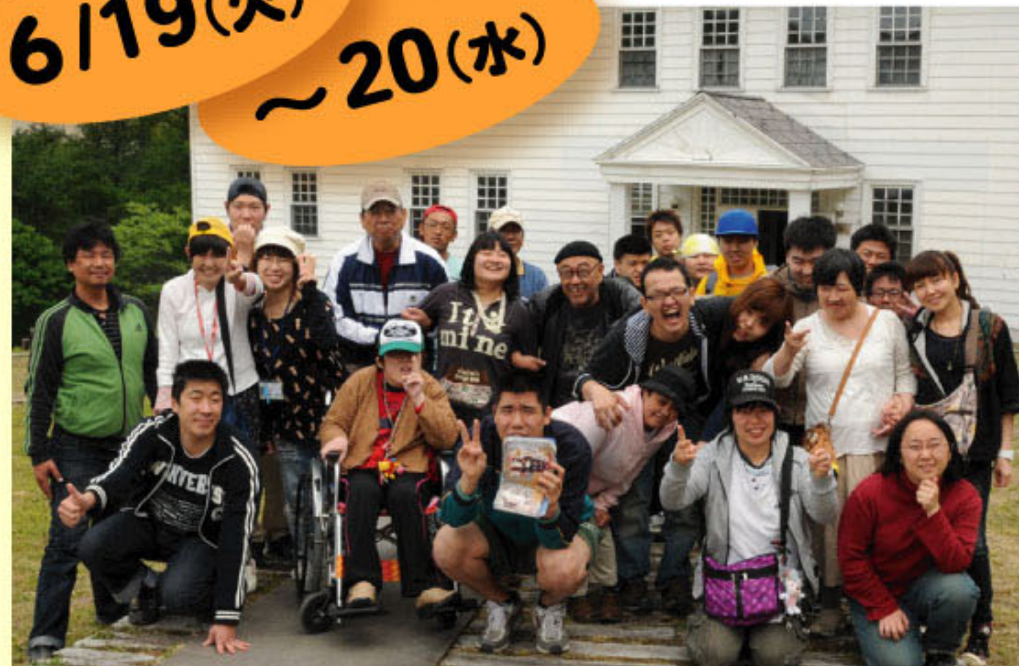
「山の家きょうどう」にて(第2班)