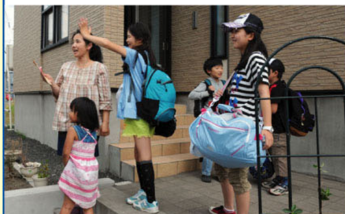
7/28 ホームステイ先へ到着