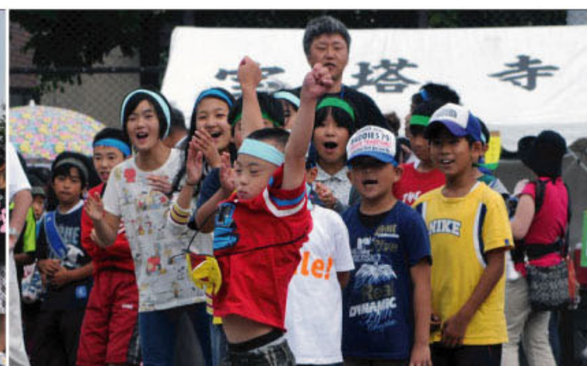
8/4 「PK町内会対抗」で大活躍！