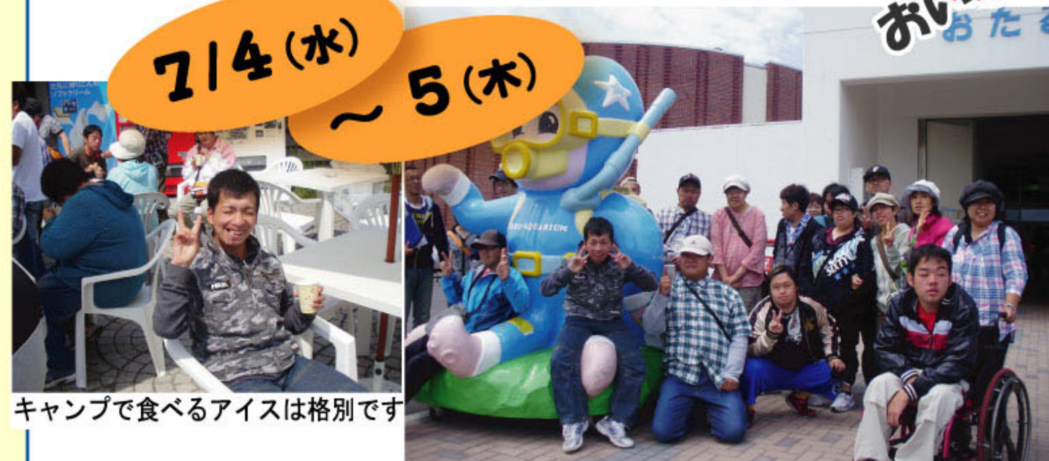
「山の家きょうどう」にて(和紙班)