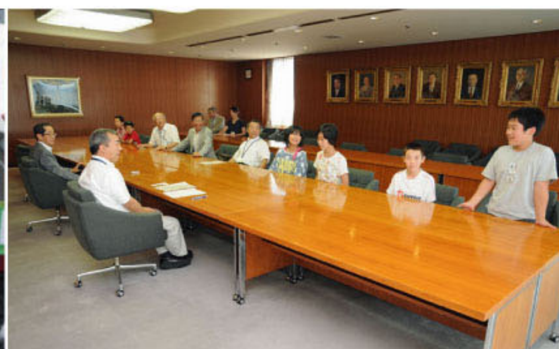
7/30 札幌市長を表敬訪問