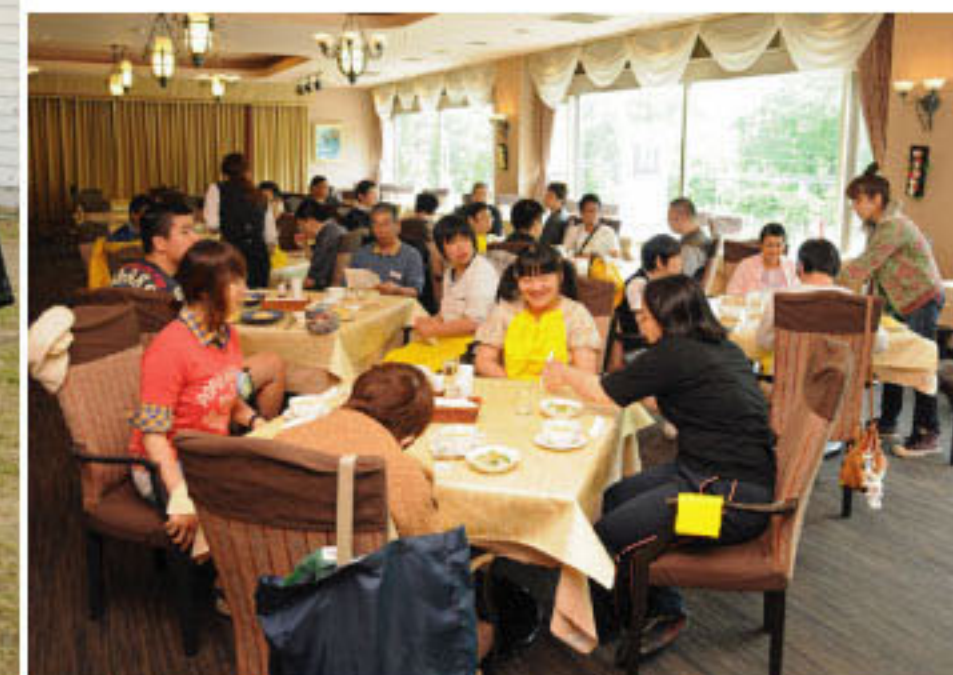
朝里クラッセホテルで昼食