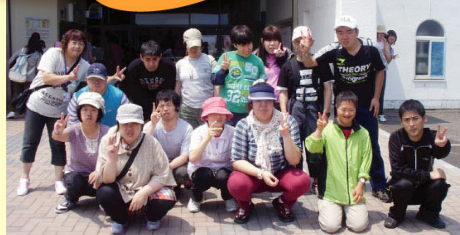
「山の家きょうどう」にて(園芸班)