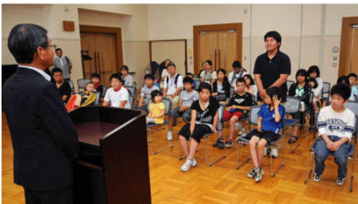
7/24 仁木町長の三浦敏幸町長を表敬訪問