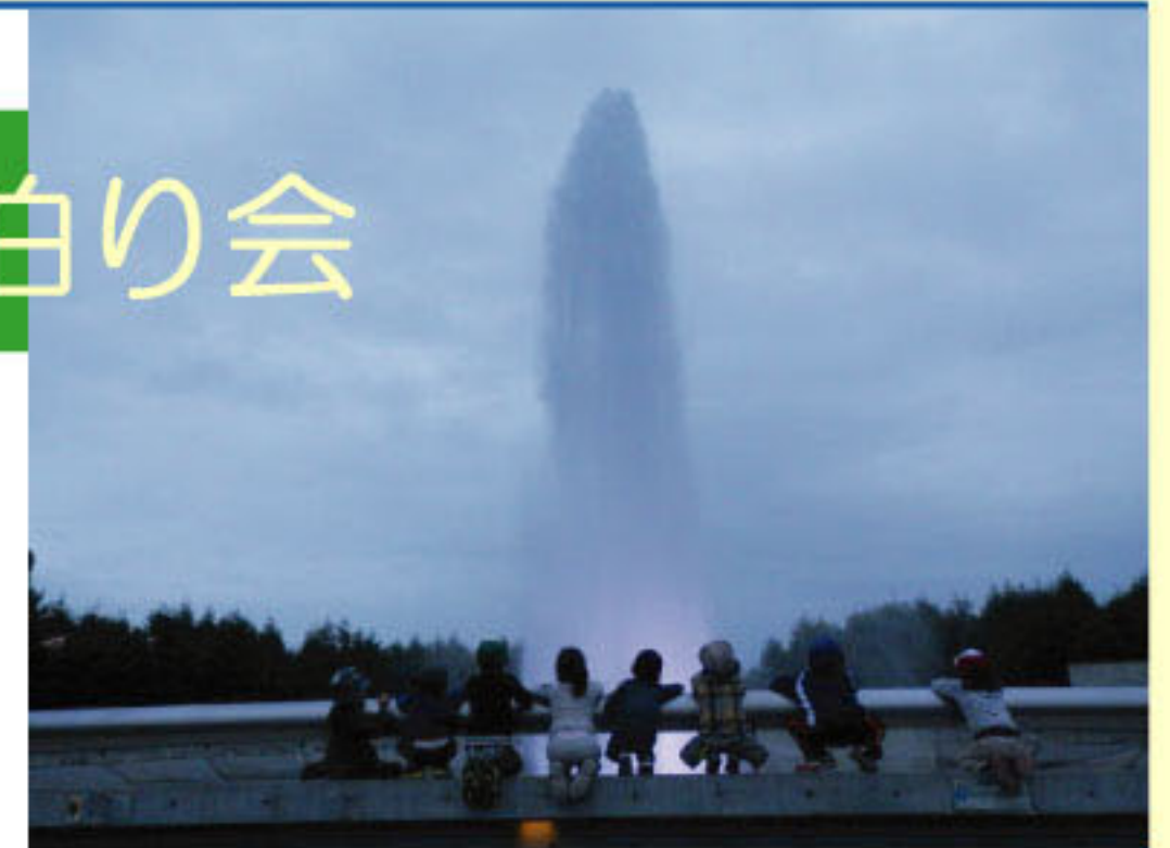
一番の思い出。夜のモエレ沼公園

去年まではそれぞれ違う保育園や幼稚園にいて、この4月に出会ったばかりのぞう組の8人。この保育園で過ごすのは1年間ですが、今後も少しでもたくさんの楽しい思い出を作って卒園を迎えてくれたら良いなあと思っています。