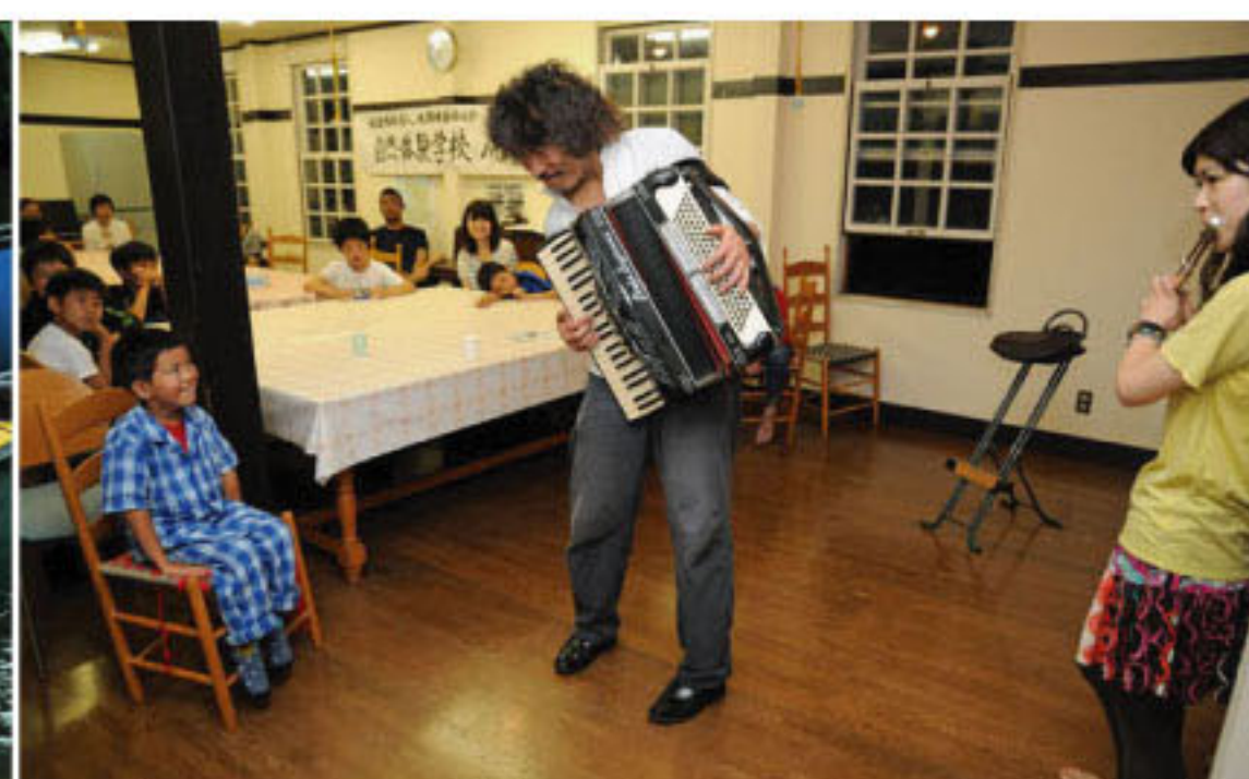
8/1 アコーディオンとフルートの演奏会