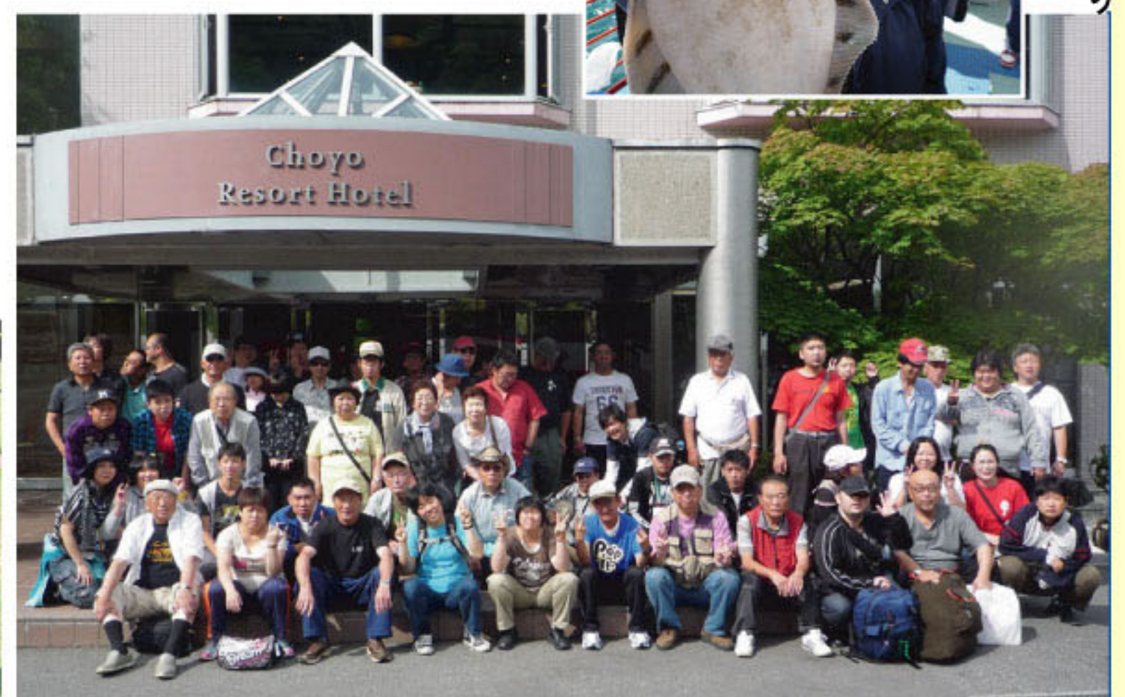
層雲峡温泉「朝陽リゾートホテル」にて