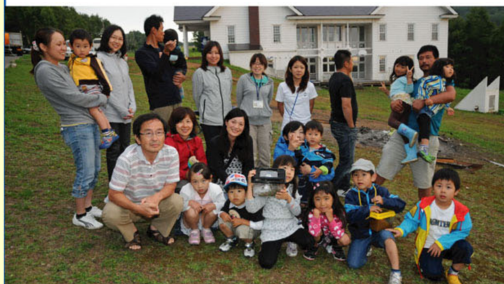
8/8 ゲストハウスのみなさんと記念写真

これから、残り少なくなってきた自然体験学校での残りのプログラムを楽しみつつ、山の家での生活をしっかりしめくくって、来年度へのつながりを確かにして終わることができるように努力したいと思います。応援をよろしく願います。