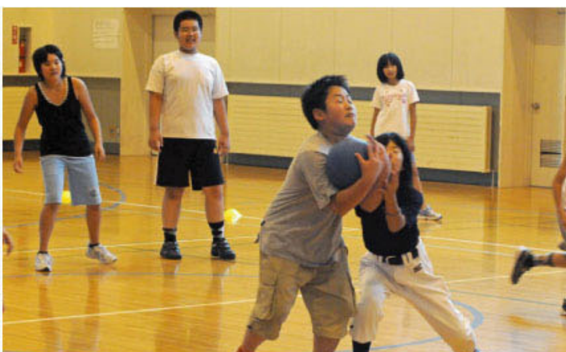
7/27 仁木小学校の児童とドッジボールで交流