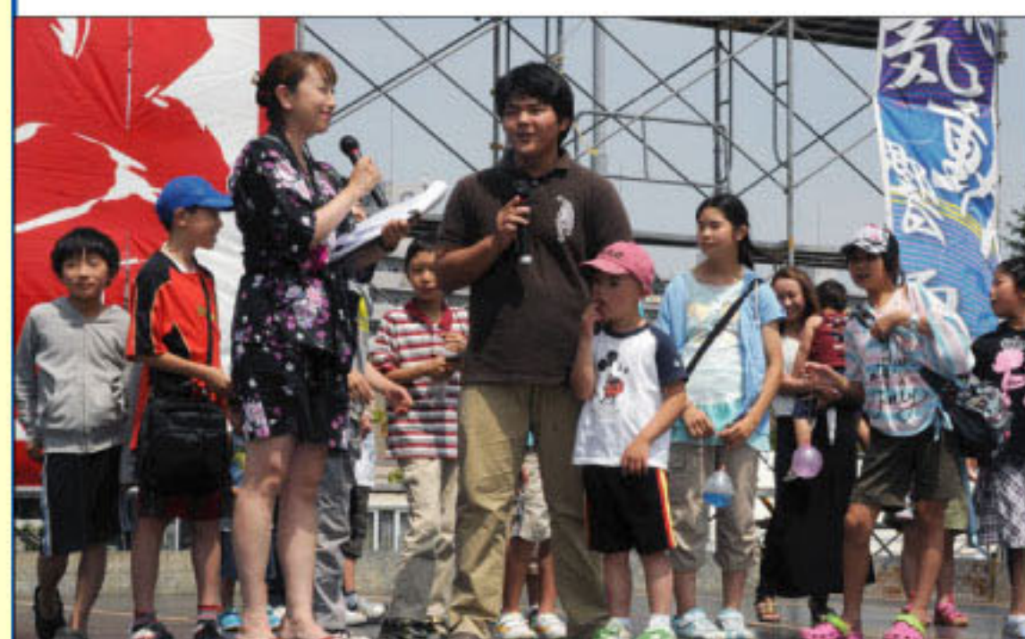
7/29 あいあい祭のステージで紹介されました