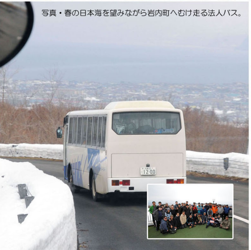
写真・春の日本海を望みながら岩内町へむけ走る法人バス。