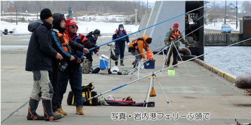
写真・岩内港フェリー碼頭で

■2012年3月17日(土)、札幌協働福祉会、今年最初の釣り旅行は1泊2日の日程で後志管内の岩内町です。一行は午前8時、車両4台で札幌市北区の本部を出発、午前11時半過ぎ目的地の岩内港フェリー碼頭に到着しました。到着後、皆さんは屋外で焼き肉の昼食をとり、そして海釣りを楽しまれました。