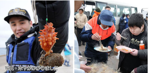
写真・ホヤがかりました