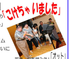
写真・足を踏み外し「オット」

17日の宿泊は岩内町の「いわない高原ホテル」です。夕食後のカラオケタイムでは自慢の歌声でおいに盛り上がりました。