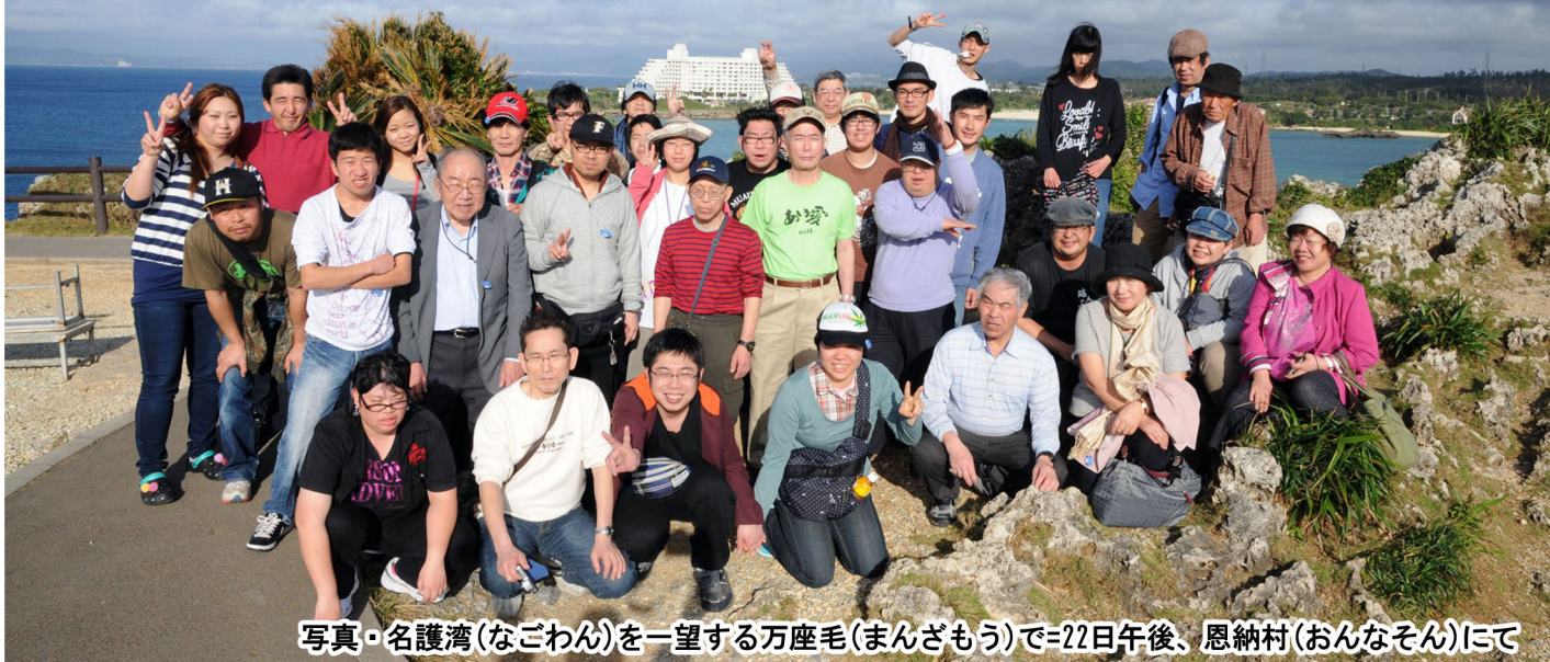
写真・名護湾(なごわん)を一望する万座毛(まんざもう)で=22日午後、恩納村(おんなそん)にて

■2012年2月22日(水)午前、アクティビティーセンター・サポートセンター協力会が主催の「2012沖縄旅行」はユーザーさん、スタッフら総勢35名が参加、22日早朝に札幌市を出発。22日(水)から25日(土)までの3泊4日の日程で沖縄本島の各地を巡りました。氷点下の日が続く北国札幌から約2240km離れた南国の沖縄本島へ、日中気温は20度を超え、皆さんは一足早く初夏を体感しました。