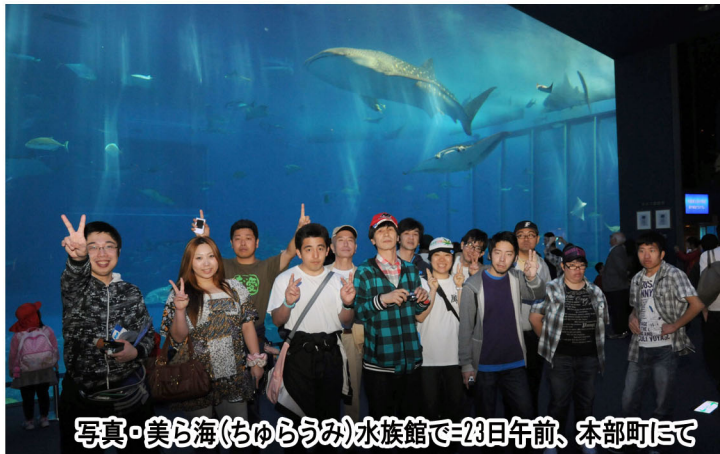
写真・美ら海(ちゅらうみ)水族館で=23日午前、本部町にて