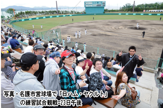
写真・名護市営球場で「日ハム・ヤクルト」の練習試合観戦=23日午後