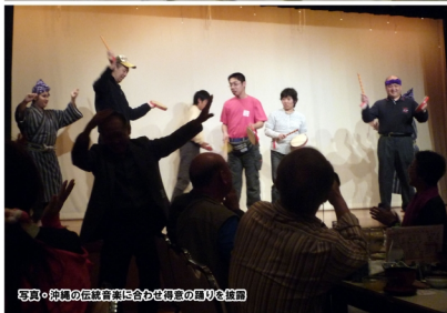
写真・沖縄の伝統音楽に合わせて舞の踊りを披露