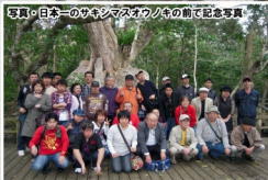
写真・日本のサキシマスオウノキの前で記念写真

■2011年2月23日(水)～26日(土)の日程で札幌協働福祉会主催の「2011沖縄旅行」が聞かれました。例年になく雪深い今年の札幌から日中気温が20度を超える南国沖縄の地へ。全員問題なく温度差の壁を乗り越えました。そして一行は石垣島、西表島、由布島、小浜等各島々を巡りマングローブの群落、水牛が引く牛車から見る南国の風景を楽しみました。