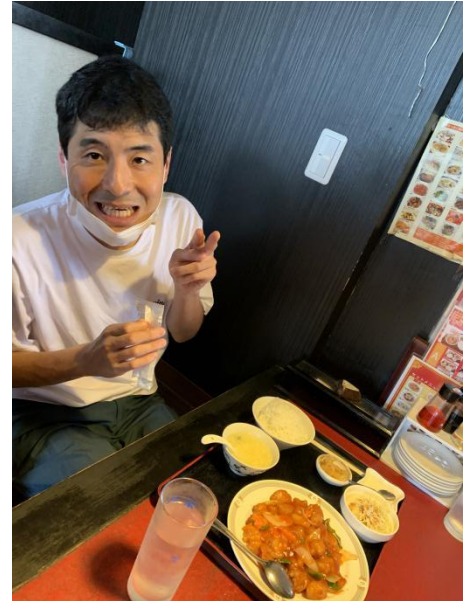
美味しそうなご飯を前にみんないい笑顔～(^▽^)