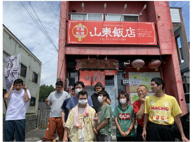
本格的な中華料理屋さん「山東飯店」に到着～