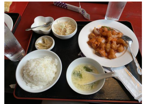
1 番人気！ザンギ定食～ザンギが大きい！！チンジャオロース定食と酢豚定食、こちらもボリューム満点！